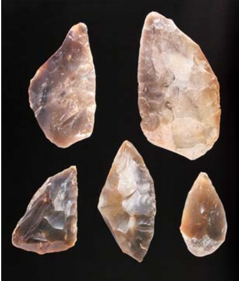
1. Pietraszyn, wyroby krzemienne z wczesnej fazy paleolitu środkowego. Fot. R. Sierka. Wszystkie fot. repr. za zgodą wydawcy.

1. Pietraszyn, flint objects from the early phase of the Middle Palaeolithic Age. Photo: R. Sierka. All photographs reproduced with the consent of the publisher.