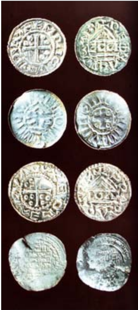
4. Lasowice, monety srebrne z X w. n.e. 4. Lasowice, silver coins from tenth century A.D.

„bęben” datowany na lata 2700-2500 p.n.e., glinianą pisanekę, „idola” z kory czy kościaną figurkę zakonnik z XIII w. n.e. Wyjątkowe zabytki to ornamentowany przedmiot z poroża renifera sprzed 15 tys. lat oraz nieposiadająca analogii gliniana „łapa”, datowana na koniec epoki brązu i prawdopodobnie związana z kultem zmarłych.