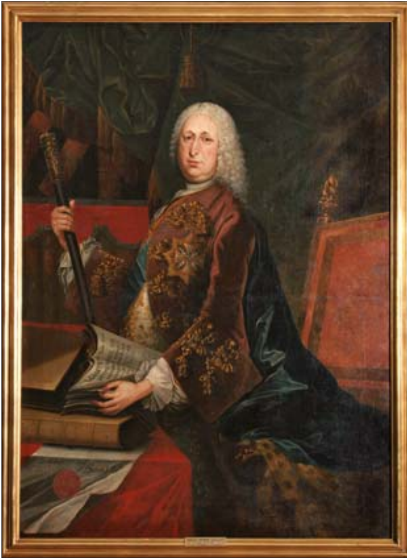
1. Marszałek Franciszek Bieliński (1683-1766), jedna z postaci historycznych najbardziej zasłużonych dla Warszawy, nie znalazł się w Słowniku, ponieważ nie istnieje ulica Bielińskiego. Ulicą, którą mu poświęcono, jest Marszałkowska. Prezentowany portret wykonał Augustyn Mirys, oryg. w zb. Muz. Hist. m.st. Warszawy.

1. Marshal Franciszek Bieliński (1683-1766), one of the historical figures of greatest merit for Warsaw, is not listed in the Dictionary because the name of his office is borne by Marszałkowska Street discussed in the publication. Portrait by Augustyn Mirys, original in the collections of the Warsaw Historical Museum.