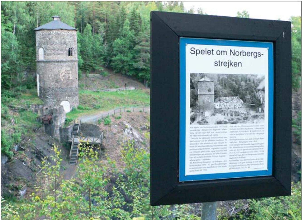
1. Ekomuseum Bergslagen, Norberg, Szwecja, szlak zabytków górnictwa rud żelaza – ekspozycja krajobrazowa zabytku wraz z informacją o jego historii społecznej. 1. Ekomuseum Bergslagen, Norberg, Sweden, a trail of monuments of iron ore mining – a landscape exposition of the monument together with information about its social history.

nia w tradycyjnym pojmowaniu istoty dziedzictwa kultury, włączenie w jego zasób zdefiniowanych dóbr niematerialnych, objęcie nim przestrzeni i krajobrazów, a jednocześnie przeniesienie punktu ciężkości zadań służb państwowych z biurokratycznego administrowania w kierunku monitorowania stanu zasobów oraz doradztwa i poradnictwa, mieszczących się w obszarze szeroko pojętej społecznej edukacji kulturalnej. Dotychczasowa tradycyjnie pojmowana ochrona zabytków staje się w ten sposób „zachowaniem wartości dziedzictwa dla przyszłych pokoleń”, w czym wyraża się daleko idące redefiniowanie celu i sposobów realizacji przedsięwzięć konserwatorskich. Towarzyszą temu następujące zjawiska: