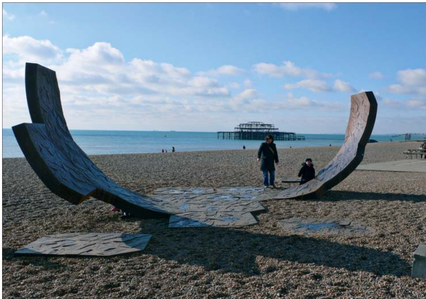
3. Brighton, Wielka Brytania, Charles Hadcock, Passacaglia (1998) – abstrakcyjna rzeźba inspirowana żeliwną konstrukcją budowli inżynierskiej mola West Pier z 1866 r., zniszczonego przez pożar w marcu 2003 r., którego szkielet widnieje w dali.

3. Brighton, United Kingdom, Charles Hadcock, Passacaglia (1998) – an abstract sculpture inspired by the cast iron construction of the West Pier from 1866, destroyed by fire in March 2003; the skeleton is seen in the background.