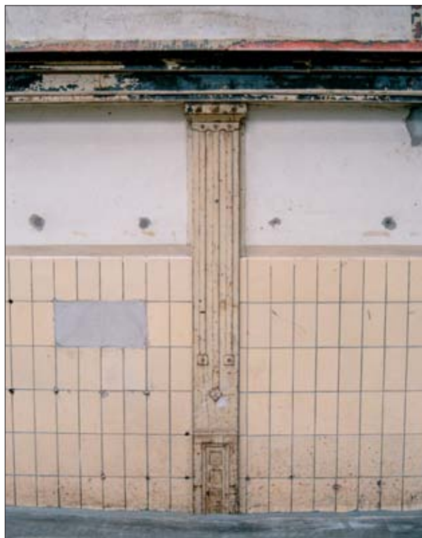
6. Jahrhunderthalle, Bochum, Niemcy, autentyczny detal ściany wewnętrznej z zachowaną patyną – postindustrialna estetyka konserwatorska zastosowana przez biuro projektowe Petzinka Pink Düsseldorf.

sano w jego statucie: „od momentu, gdy Prometeusz wykradł ogień, ludzkość ulega technicznemu imperatywowi, odgrywającemu decydującą rolę w dziejach świata. Mimo to nasza problematyka była pomijana przez »oficjalnych« historyków na korzyść politycznej, gospodarczej, wojskowej i s p o ł e c z n e j , a ostatnio – historii kultury, mimo że np. powstanie i zastosowanie komputera odegrało znacznie ważniejszą rolę w historii Brytanii końca XX wieku niż jakikolwiek rząd. Sławni inżynierowie i uczeni, jak Brunel, Davy, Faraday, Telford, Watt i Stephenson – żeby wspomnieć tylko niektórych – w rzeczywistości odegrali ważną rolę w historii inżynierii i techniki, lecz jest to temat szeroki, związany z wytworami i produkcją, ich projektowaniem, ekonomią, z relacjami społecznymi, głównymi decydentami i wydarzeniami. Mit prometejski wyraża uznanie ognia przez starożytnych Greków za podstawowy czynnik obróbki metalu, a przez to i za fundament ich cywilizacji. Badając tę problematykę, my