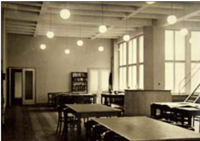
9. Czytelnia młodzieżowa w nowym pawilonie biblioteki, 1938 r. (zbiory ABP, sygn. F.I.60, S. Turski).

8. Hall with cloakroom in the new Library pavilion, 1938 (collections of BP, call no. F.I.58, S. Turski).