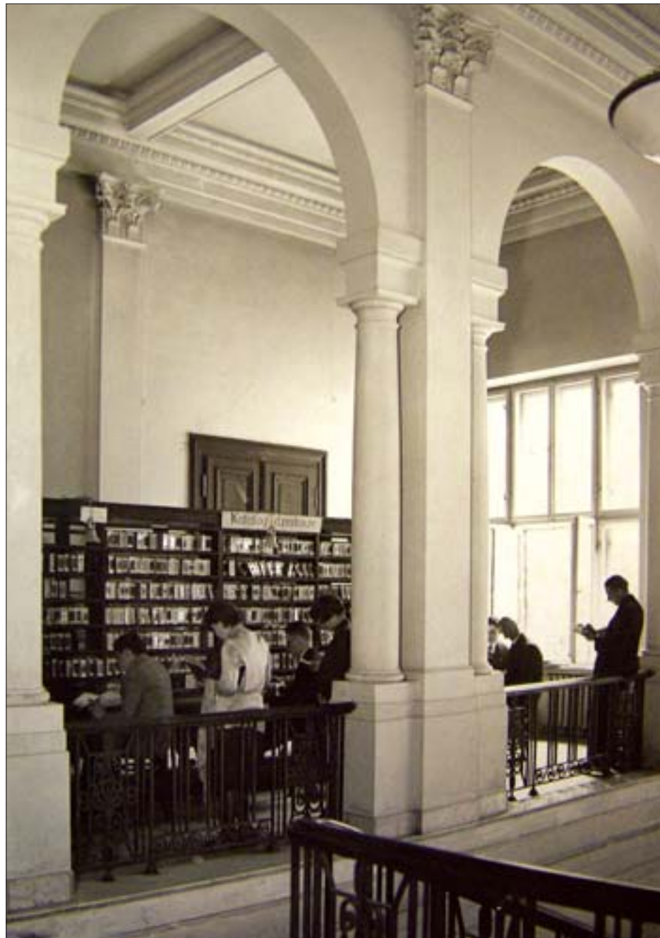
1. Hol na I piętrze, katalog działu zasadniczego, 1930 r.