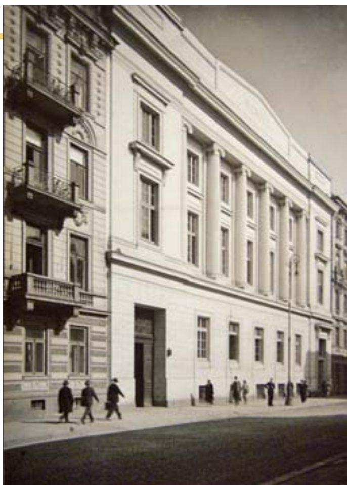
4. Fasada gmachu biblioteki – lata 30. XX w.