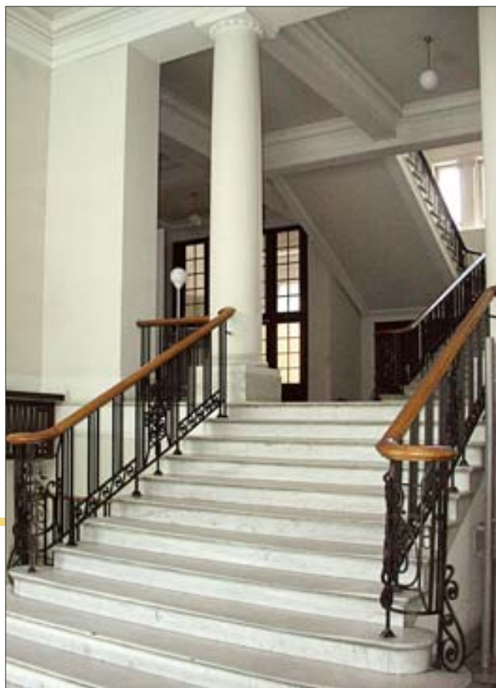
13. Fragment holu parteru i galerii I piętra gmachu głównego, 2005 r. 13. Fragment of the ground-floor hall and the first-floor gallery in the main building, 2005.