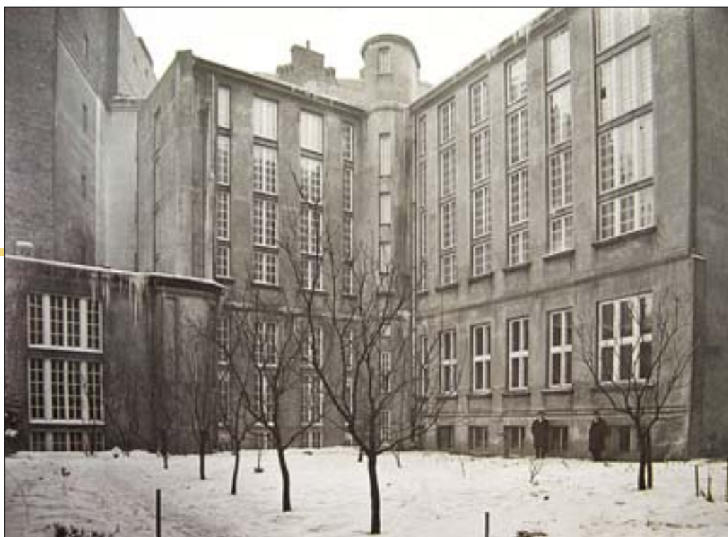
6. Podwórze III z widokiem na magazyny książek, 1931 r. (zbiory ABP, sygn F.I.41, H. Poddębski).

Boniowany w tynku parter zdobiły duże prostokątne okna. Na wyższych kondygnacjach architekt zastosował wglębny portyk w jońskim porządku, flankowany płytkimi ryzalitami. Między kanelowanymi kolumnami, dźwigającymi belkowanie, kryły się okna czytelnia główna. Całość wieńczył płaski, trójkątny fronton, którego wewnętrzne pole zdołał napis „MCMXIII”, wskazujący datę powstania gmachu. Pierwszy z projektów rozwiązania fasady, niezakceptowany przez E. Kierbedź zapewne ze względów finansowych i estetycznych, przewidywał w tym miejscu rzeźbiarską dekorację reliefową o motywach zaczerpniętych ze sztuki antycznej: centralnie umieszczoną sowę (symbol mądrości, wiedzy i wojny – atrybuty bogini Ateny) w otoczeniu centaurów i ludzi 14 (il. 3). Elementy rzeźbiarskie dekorowały też wierzchołki ryzalitów. Ponadto przekształcony później projekt fasady charakteryzował się innym opracowaniem faktury ściany: kamiennymi, rustykalnymi płytami; odmiennym rozmieszczeniem otworów wejściowych (główne wejście do budynku zakomponowano na osi środkowej); dekoracją okien (z kratami w parterze i suterrenach) itp.