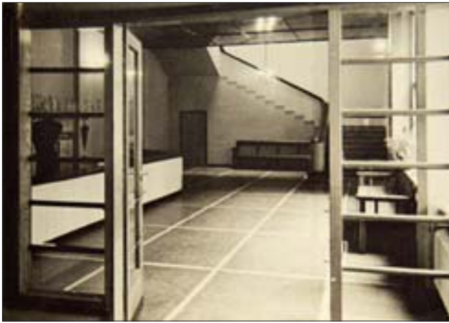
8. Hall z szatnią w nowym pawilonie biblioteki, 1938 r. (zbiory ABP, sygn. F.I.58, S. Turski).

8. Hall with cloakroom in the new Library pavilion, 1938 (collections of BP, call no. F.I.58, S. Turski).