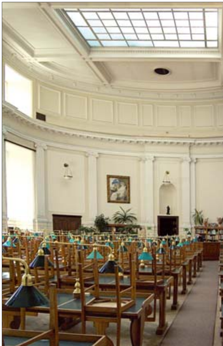
12. Czytelnia główna, 2005 r. 12. Main reading room, 2005.

Biblioteka Publiczna m.st. Warszawy niemal od momentu powstania boryka się z problemami lokalowymi. Kolejne zmiany tylko na krótki czas zaspokajają rosnące potrzeby instytucji. Jej obecna działalność