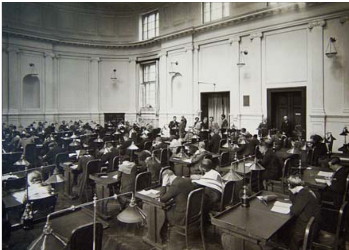
7. Czytelnia główna, 1930 r. (zbiory ABP, sygn. F.I.37, H. Poddębski). 7. Main reading room, 1930 (collections of ABP, call no. F.I.37, H. Poddębski).

Pozostałe elewacje gmachu nie były już tak ozdobne, a ich wygląd wynikał z przeznaczenia poszczególnych części biblioteki. O ile elewacje tylne frontu rozwiązano, stosując jeszcze elementy dekoracyjne w postaci boniowania w tynku czy prostych obramień okiennych, o tyle magazyny całkowicie pozbawiono detali architektonicznych (il. 5, 6). Wertykalne okna przedzielone wąskimi filarami uzewnętrzniały strukturę wewnętrzną: żelbetową konstrukcję obiektu.