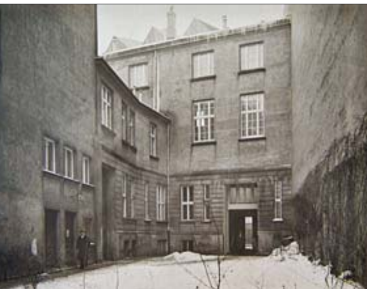
5. Podwórze I biblioteki, z lewej strony brama do podwórza II i wejście do wypożyczalni, 1931 r. (zbiory ABP, sygn F.I.40, H. Poddębski).

5. Courtyard I of the Library, to the left: gate to courtyard II and entrance to the lending library, 1931 (collections of ABP, call no. F.I.40, H. Poddębski).