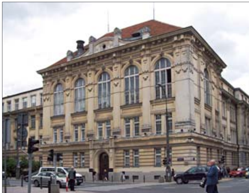
9. Fasada gmachu Wydziału Architektury Politechniki Warszawskiej, stan obecny.

Większość wykładowców wydziału związana była z Towarzystwem Opieki nad Zabytkami Przeszłości. Nie było to bez znaczenia w przyjętym procesie kształcenia. Indywidualne poglądy prowadzących decydowały