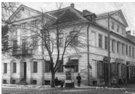
Stup ogłoszeniowy na rogu ulicy Grodzkiej i placu Kanonicznego (obecnie przed Biblioteką im. Zielińskich TNP)