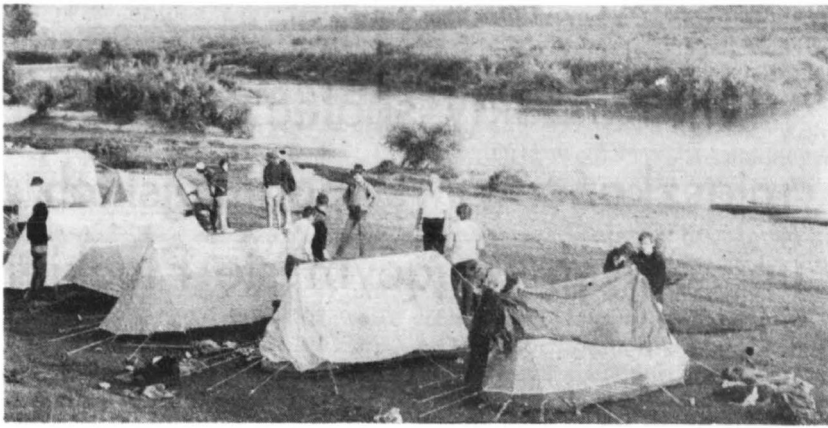
Splyw kajakowy pracowników Izokoru Wisłą z Wyszogrodu do Płocka. Odpoczynek w Kępie Polskiej.

siębiorstwa, pracownię projektową i Płocki Oddział Centralnego Ośrodka Bad.-Rozwojowego Techniki Instalacyjnej. Obiekt wzniesiony zostanie kosztem ok. 14 mln zł.