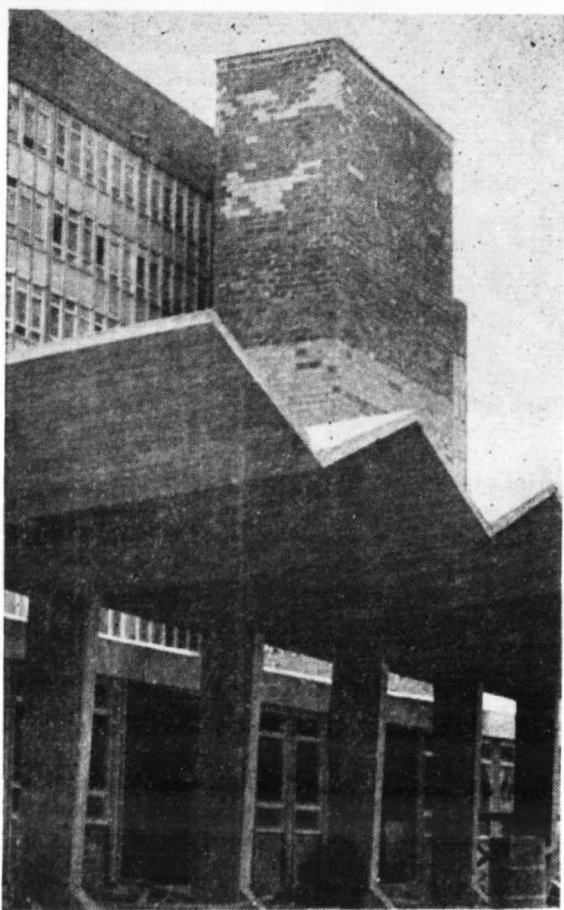
Budynek główny (część wejściowa) nowego szpitala im. prof. dr Marcina Kacprzaka. Oddanie do użytku przewiduje się na rok 1973.

których przyjęto 1.649 dzieci, tj. 35,7% w stosunku do ogółu dzieci w wieku przedszkolnym.