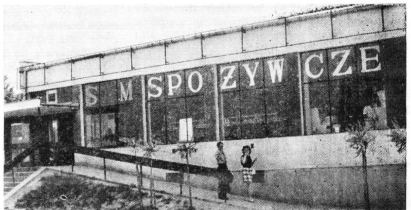
SAM ogólnospożywczy MHD przy ul. Miodowej, uzyskany w drodze adaptacji dawnej kotłowni osiedlowej.

W przeciwieństwie do lat 1961—1966, kiedy to nastąpił poważny wzrost liczby przedszkoli (z 9 w 1961 roku do 12 w roku 1965), w latach 1966—1970 oddano zaledwie jedno przedszkole przy ul. Bielskiej, nie wybudowano zaś przewidzianego w planie przedszkola na osiedlu Tysiąclecia. Na koniec 1970 roku mieliśmy w 13 płockich przedszkolach 1.256 miejsc (na 4.617 dzieci w wieku przedszkolnym 3—6 lat), 14 do