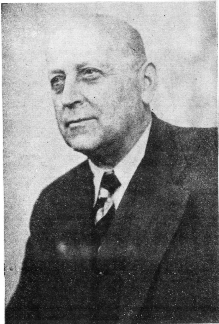
MARCIN KACPRZAK 1888 — 1968