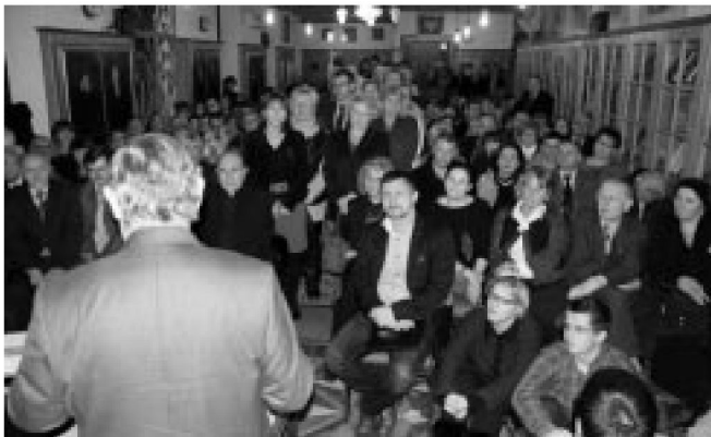
Sala konferencyjna TNP wypełniona po brzegi publicznością przybyłą na spotkanie z Normanem Daviesem

Długo przed godziną 17 00 , na którą zaplanowano wykład, zaczęła przybywać publiczność szybko zapełniająca salę konferencyjną. Zajętych zostało nie tylko blisko 150 krzeseł, zainteresowani stojąc, wykorzystywali każdą wolną przestrzeń, kilka osób przysiadło nawet na podłodze, tuż przy stoliku prelegenta.