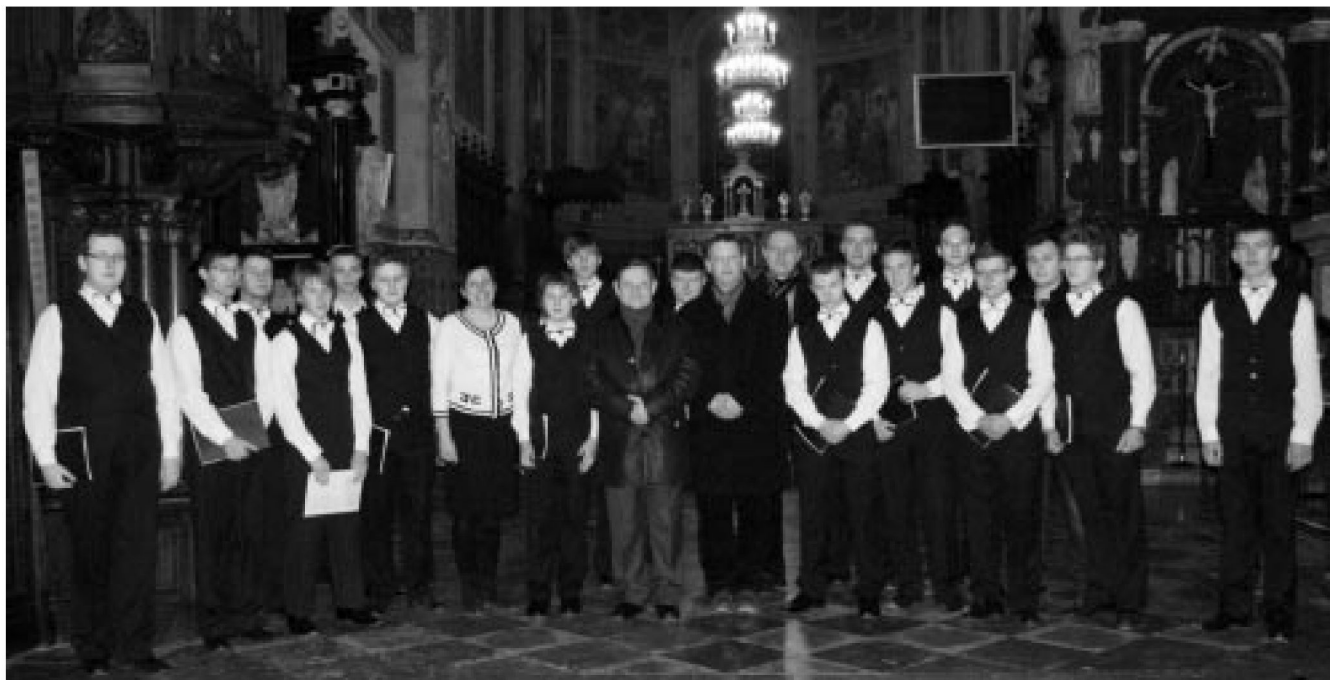
W katedrze dla Normana Daviesa zaśpiewał chór Pueri Cantores Plocenses

oprócz tego, że zajmują się czymś innym, też mają swoją historię. Zatem wiele jest pól badań w obszarze historii i dlatego konieczna jest selekcja. W książce Zaginione królestwa autor skupił się na dziejach państw, często imperiów, które przestały istnieć, jak np. Wielkie Księstwo Litewskie czy Królestwo Aragonii. Było jednak ich zbyt wiele, by wszystkie omówić podczas jednego spotkania autorskiego. Będąc w Płocku historyk postanowił opowiedzieć o Prusach, bowiem losy tego państwa powiązane były z Mazowszem i Płockiem, głównie za sprawą księcia Konrada Mazowieckiego. On to bowiem sprowadził Krzyżaków, którzy podporządkowali żyjące w Prusach ludy pogańskie i wprowadzili tam chrześcijaństwo. Był to drugi okres w historii Prus spośród dziewięciu, jakie prof. Davies wyróżnił i omówił podczas spotkania w TNP.