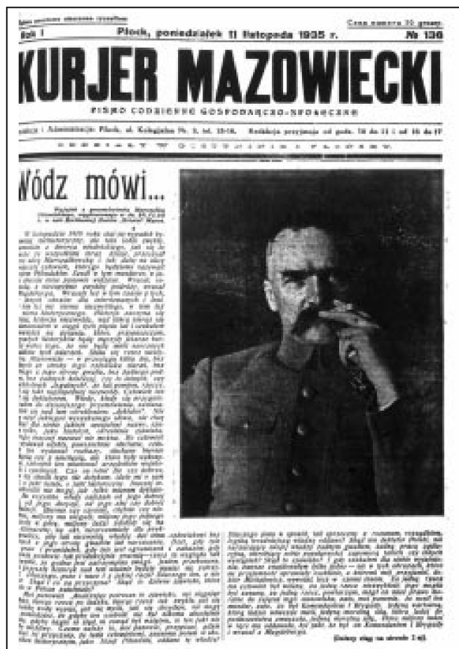
Fot.2. „Kurier Mazowiecki” z 2 listopada 1935 r.

Tak oto dokonana się przemiana tegoroczna między wiosną a jesienią.