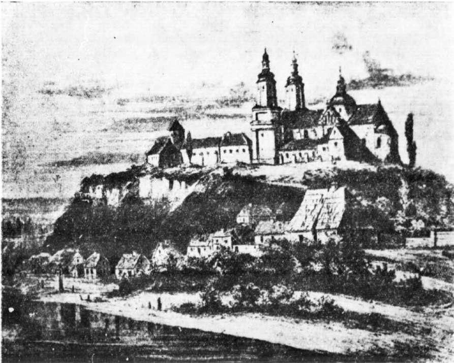
Płock wg rysunku Kozarskiego z r. 1863.