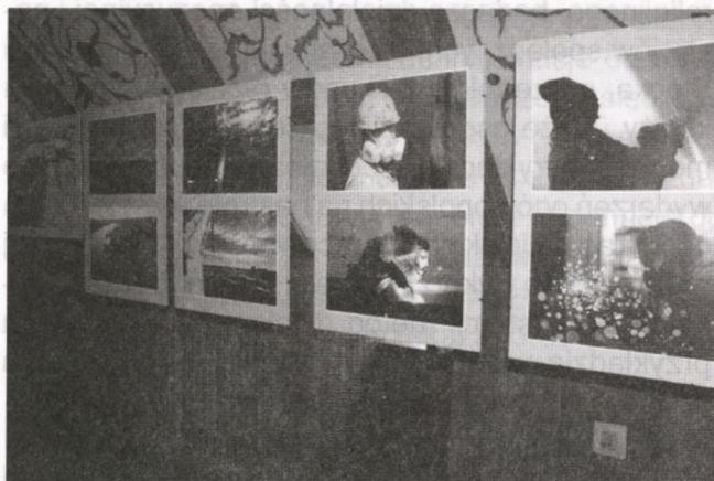
Fot. 1. Fragment ekspozycji w sali wystawowej

25 czerwca 2009 r., w Dniu Stoczniowca, Towarzystwo Naukowe Płockie otworzyło wystawę fotografii zatytułowaną W płockiej stoczni rzecznej , którą można było oglądać do końca lipca. Zaprezentowano na niej zdjęcia pracownika firmy Centromost Stocznia Reczna w Płocku Jakuba Nykiela. Z wykształcenia informatyk, z zamiłowania fotograf, który rzemiosła uczył się przed laty na zajęciach prowadzonych przez Tomasza Niestuchowskiego, fotoreportera „Gazety Wyborczej”. Jakub Nykiel od kilku lat utrwała na fotografiach codzienne życie zakładu, proces produkcji, pracę konstruktorów i budowniczych statków. Portretuje stoczniowców. Na wystawie w TNP pokazał 40 fotografii w dużych formatach dokumentujących tę trudną pracę wymagającą siły połączonej z precyzją i dokładnością.