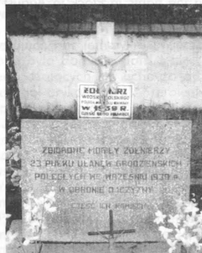
Zbiorowa mogiła 23 Pułku Ułanów Grodzieńskich poległych w 1939 roku w miejscowości Przysucha 10 koło Radomia

Wojna polsko–bolszewicka z sierpnia 1920 roku w Płocku jest wciąż żywym elementem pamięci nowych pokoleń mieszkańców. W walce obok ludności miasta uczestniczyło wiele jednostek wojskowych. 211 pułk ułanów, który pozytywnie zapisał się w historii walczył we wsi Góra 11 w pobliżu Płocka, gdzie odniósł zwycięstwo. Zdobył jeńców i broń. Dowódcy i oficerowie wykazali odwagę i bohaterstwo. Za czyny bojowe uzyskali order i odznaczenia. Pułk w swojej księdze chwały niesie następnym pokoleniom żołnierzy opis walki i postępowania w chwili zagrożenia Ojczyzny.