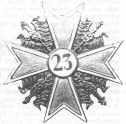
Odnaka pułkowa 23 Pułku Ułanów Grodzieńskich