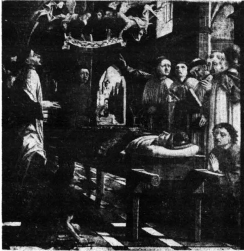
Św. STANISŁAW NA MARACH GRAZ. MICHAEL PACHER?

Druga ze scen wyobraża również wnętrze świątyni, w której na planie pierwszym widoczne są nosze ze zwłokami biskupa. Wokół zmarłego zgrupowali się duchowni, nad ciałem anieli ze wstęgą nut symbolizujących modły. — Światło wpadające do wnętrza w wysoko wykrojonych oknach nadaje mu zielonoszary i zimny koloryt świadczący o powadze chwili.