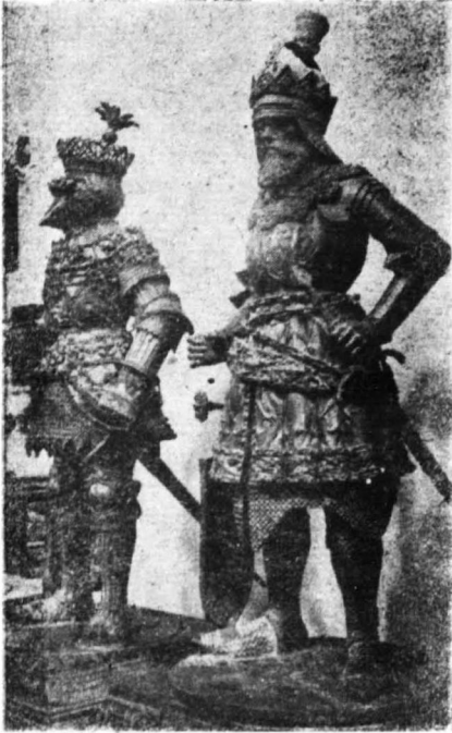
ERNEST ŻELAZNY i FERDYNAND PORTUGALSKI Innsbruck GILG SESSELSCHREIBER

tych ludzi przyszło na świat dziesięcioro dzieci, z których Fryderyk V, — jako cesarz niemiecki Fryderyk III, ożeniony z Eleonorą księżniczką Portugalii, był ojcem wielkiego miłośnika i mecenasa sztuki, znanego w historii polityka, niezbyt przychylnego sprawom Polski, cesarza Niemiec i regenta Tyrolu, — Maksymiliana I. Hi-