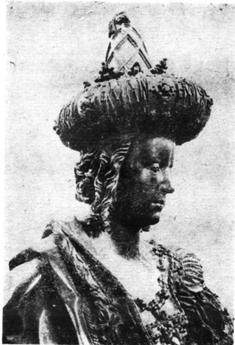
CYMBARKA — FRAGMENT INNSBRUCK. GILG SESSELSCHREIBER

postaci św. Tomasza Becketa, to ów kaleka, zapewne Piotrowin, — według legendy wskrzeszony przez biskupa w trzy lata po tegoż śmierci, — atrybut polskiego świętego w scenie znającego męczennika na marach. Atrybut, który sztuka średniowieczna stosowała niemal z reguły.