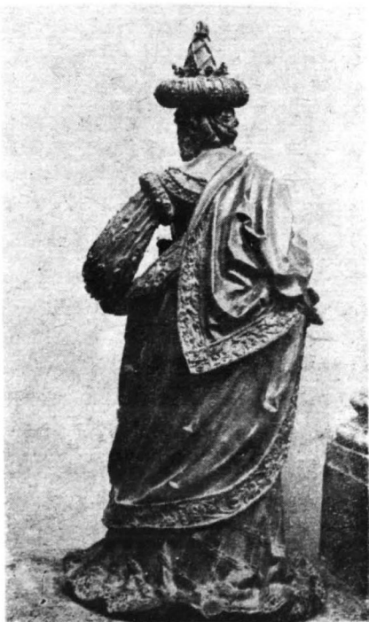
CYMBARKA — FRAGMENT INNSBRUCK. GILG SESSELSCHREIBER

Księżna z Płockiego Mazowska pełna goetyckiej impresji w całej postaci i wyrazie twarzy, przy egzotycznym nakryciu głowy, zbliżonym do kształtów tureckiego turbanu, zwanym wówczas „punt”, różni się nieco od pozostałych figur. Draperia szat modelowanych w czerwieniącym tonie miedzi podkreśla nie tylko zalety warsztatu, ale i piękność kobiecych kształtów. Po mistrzowsku wypracowana twarz księżnej, swobodnie wysuwające się z ramion linie szyi i ramion oraz wspaniale oddana partia biustu ze zwisającym na nim łańcuchem kosztowności, oddychają swobodą rzemiosła i sztuki. Piękno i realizm wyrazu w rzeźbie napełniają podziwem. Cymbarka jest bodaj czy nie najpiękniejszą postacią wśród rzeźb innsbruckiego grobowca i postacią, która zwraca powszechną uwagę zarówno miłośników jak i znawców sztuki.