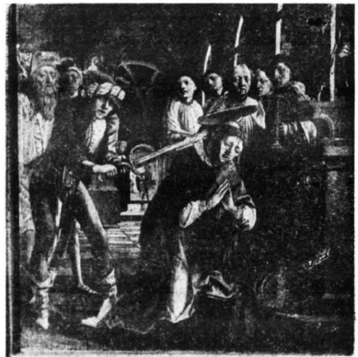
ZABÓJSTWO ŚW. STANISŁAWA GRAZ. MICHAEL PACHER?

Pierwszy z obrazów przedstawia wnętrze kościoła, do którego poprzez gotyckie okna z prawej strony wpada światło umożliwiające dojrzeć rozgrywającą się akcję. U stóp ołtarza, widzianego od strony zamknięcia prezbiterium, klęczy w czerwonym płaszczu i białej tunice duchowny w otoczeniu święty z jednej strony i grupy ludzi świeckich, z których najbliższy, odziany w biało-czerwony i spiczasto zakończony turban oraz w ciemno-fioletowy kaftan i żółte obuwie, — uderza oburącz mieczem w głowę dostojnika. Mitra biskupia leży u jego kolan na stopniu ołtarza, nad głową aureola, ręce złożone do modlitwy. Na twarzach pięciu mnichów towarzyszących męczeńskiej śmierci być może dominikanów widać zdziwienie, współczucie i przestrasz. Tuż za mordercą stoi niewzruszony brodaty mężczyzna w charakterystycznym