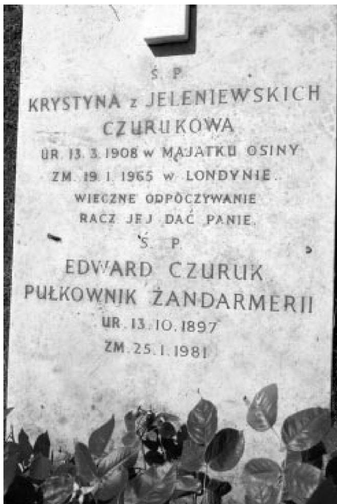
Grób Czuruków na polskim cmentarzu Gunnersbury w Londynie.

Anglii, gdzie zmarła 19 stycznia 1965 r. W Anglii zmarł również 25 stycznia 1981 r. Edward Czuruk. Obydwoje są pochowani w Londynie na polskim cmentarzu Gunnersbury we wspólnym grobie (Sq. EB, gr. 87) 22 . Cmentarz Gunnersbury, na którym wzniesiony został w 1976 r. Pomnik Katyński, jest dziś najbardziej „polskim” cmentarzem Londynu, miejscem oficjalnych obchodów rocznicowych i państwowych uroczystości. Na tym cmentarzu pochowany został w 1960 r. gen. Józef Haller, a w 1966 r. gen. Tadeusz Bor Komorowski.