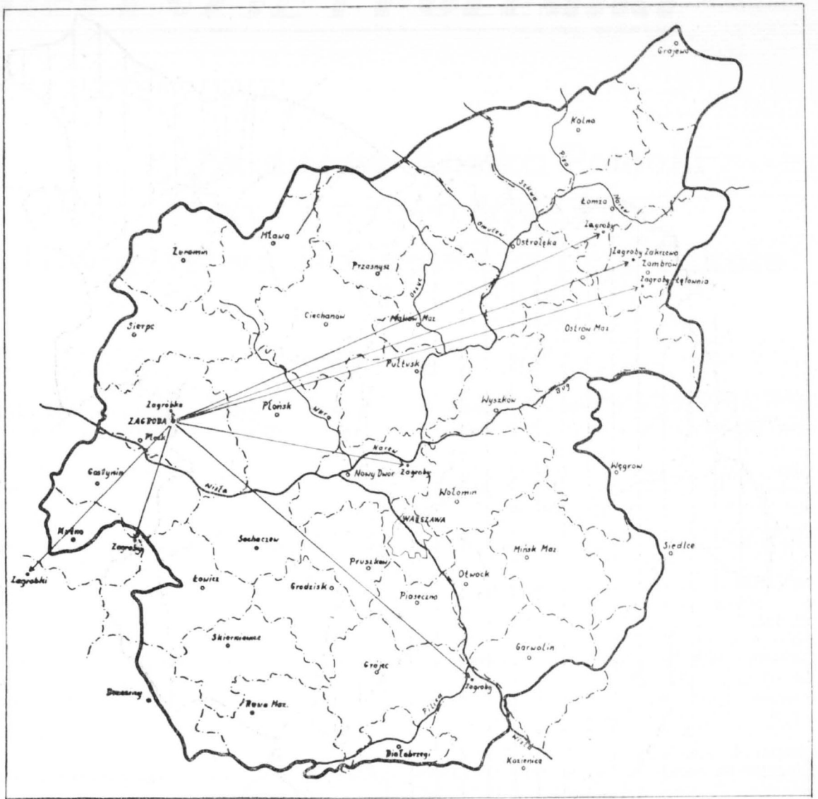
MAPA NR 1

Po przejrzeniu w Herbarzu polskim nazwisk szlachty pieczętującej się herbem Zagłoba, stwierdzić można, że najczęściej Zagłobczyków przebywało na północnym Mazowszu, w byłej ziemi wiskiej, ale emigrowali oni również w Łęczyckie, Rawskie, Łowickie i daleko bo aż do Litwy, Inflant i na Podole. Chyba z kresów wschodnich znane było to nazwisko H. Sienkiewiczowi, który je uwiecznił w Trylogii nazywając Zagłobą jedną z najbardziej popularnych postaci tego utworu.