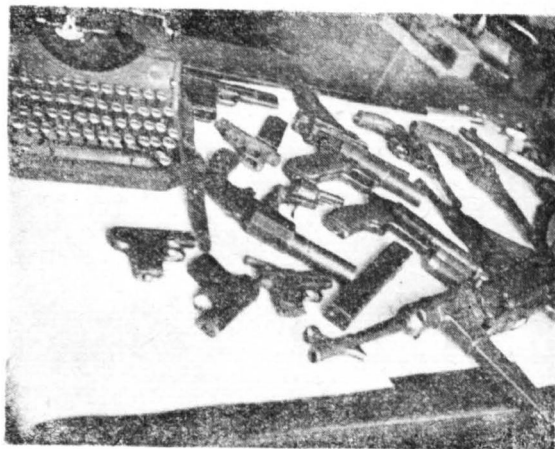
Broń złożona w Komitecie Powiatowym PZPR w Płocku, zdobyta na Niemcach w czasie okupacji

Przed partią stanęły nowe zadania — zagadnienie organizowania władzy w zniszczo-