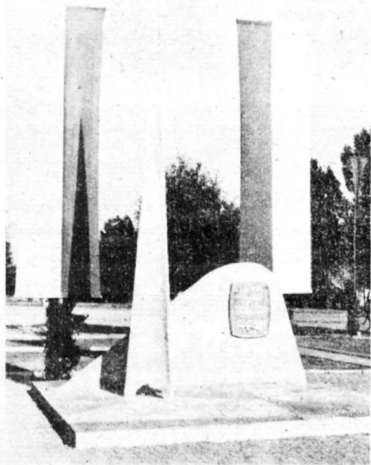
Obelisk odsłonięty 12. VII. 1959 r. w Małej Wsi w XVI-tą rocznicę wyruszenia pierwszego oddziału A. L. północnego Mazowsza