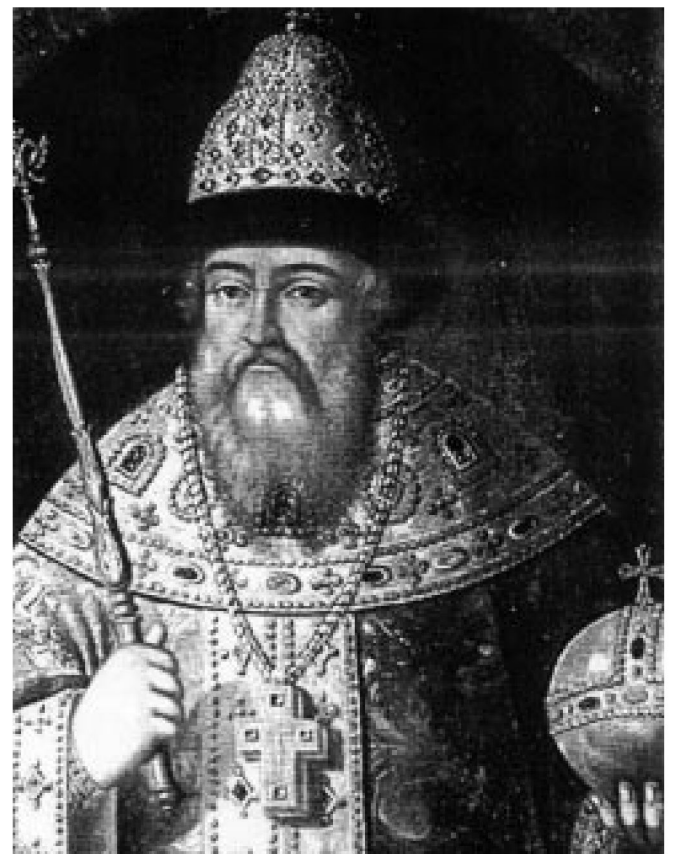
Fot. 6. Car Wasyl IV Szujski (1552–1612)

Świadectwa zejścia tych dwóch książąt oraz żony Dymitra Katarzyny zapisane zostały do akt miejscowych w księgach grodu gostynińskiego, których kopie dotąd są przechowywane czytamy w „Słowniku Królestwa Polskiego”, tom II, Warszawa 1881 r., s. 749.