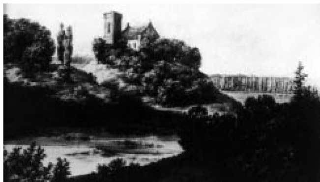
Fot. 4. Gostynin. Widok zamku w 2. poł. XIX w. wg Napoleona Ordy

Dymitr Cwietajew w swoim opracowaniu „Car Wasilij Szujskij i miasta pogriebienija jego w Polsce 1610–1910 g.g.; I tom. Istoriceskoje issledowanije, Moskwa–Warszawa 1910 dodaje, że carewiczów otaczano „właściwą czcią” czyli że obchodzono się z nimi po królewsku. Mimo, że carewiczów trzymano pod strażą „uczciwie ich jednak podejmowano”. Car Wasyl Szujski miał mieszkać w murowanej izbie nad bramą zamkową. Pomieszczenie, w którym mieszkał car, było zamykane na zamek i zasuwę. Izba miała cztery okna, podłogę z gładkiej cegły, polerowany piec, kominek oraz szafę w ścianie. W pobliżu izdebki przebywała straż wojskowa 17 . Nadmienić też trzeba, że przynajmniej początkowo więźnia ukrywano przed otoczeniem, zaś dostęp do niego był trudny 18 . Natomiast księcia Dymitra z żoną Katarzyną miano umieścić w niewielkiej murowanej izbie