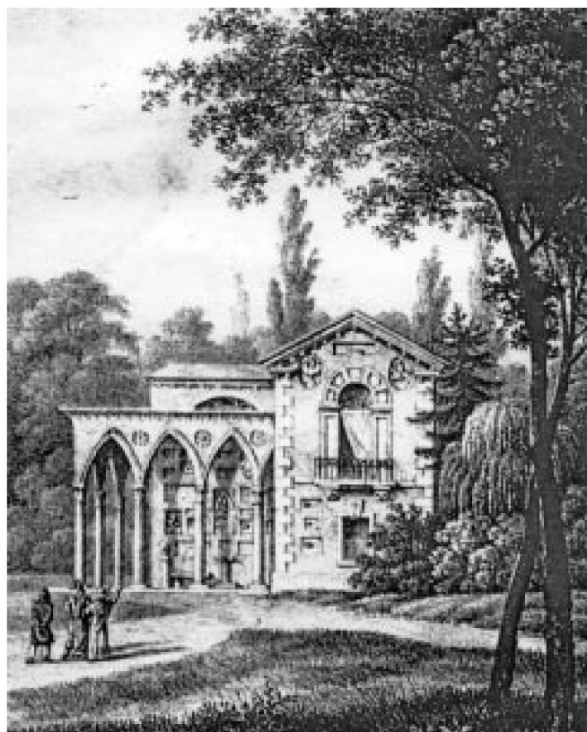
Fot. 10. Dom Gotycki w Puławach – Izabela Czartoryska.

ryczna „Za zamkową bramą” 45 . Przypomniano też, że w 1828 r. w Warszawie wydano książkę Izabeli Czartoryskiej współwłaścicielki pałacu i dóbr ziemskich w Puławach. Z jej inicjatywy wybudowano w latach 1801–1809 w pobliskim parku Dom Gotycki. Jedna ze ścian budynku otrzymała nazwę „Ściana Gostynińska”. Wśród wielu różnych zabytków przytwierdzonych do ściany pod numerem 178 znalazły się: „Cegły i drzewo wzięte z pokoju w Gostyninie, w którym Szujscy poumierali”. W sąsiedztwie znalazły się pod numerem 179 „Kule małe, i blaszka z orzełkiem na niej wyciśniętym, z pola bitwy pod Waterloo”, zaś pod numerem 180 „Kawał gipsu, wyrobiony; z pałacu papieży w Awenionie” 46 . Warto jeszcze nadmienić, że po roku 1831, tj. po upadku powstania listopadowego nastąpiła konfiskata dóbr Czartoryskich z polecenia rządu carskiego. Wówczas to większość elementów kamiennych umieszczonych w ścianach Domu Gotyckiego została przez Rosjan usunięta, a następnie zniszczona, jako oznaki polskości. Jak zaznacza Zdzisław Żygulski (Jun.) w książce pt. „Dzieje zbiorów Puławskich” (Świątynia Sybilli i Dom Gotycki), Kraków 1962, s. 236: „W sensie ogólniejszym wpływ Puław kształtował postawę narodu w okresie niewoli, nie-