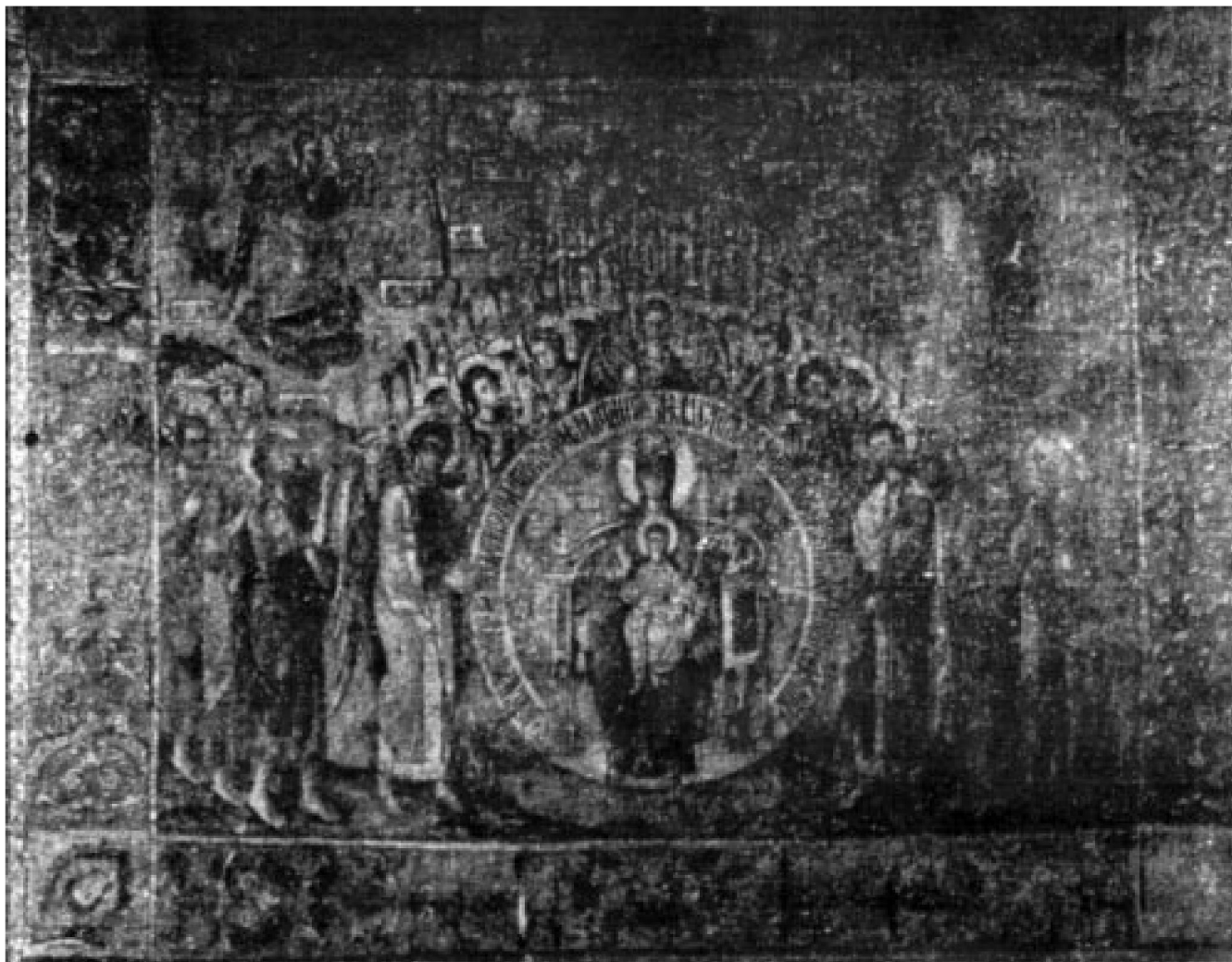
Fot. 1. Chorągiew moskiewska zdobyta pod Kłuszynem w roku 1610, przeniesiona została do Świątyni Sybilli w Puławach z Katedry wawelskiej. Kopia chorągwi zostanie zawieszona w zamku gostyńskim

scy, jak i litewscy. Zaczęła się interwencja polska w sprawę państwa moskiewskiego, krytykowana przez niektórych ówczesnych polskich polityków, jak np. przez hetmana wielkiego koronnego Jana Zamoyskiego. Na marginesie powyższego rosyjski historyk Siergiej Płatonow pisał, że „tylko niemądre państwo nie skorzystałoby z takiej okazji i nie wmieszałoby się w zawieruchę w Rosji” 5 . Armia polska podeszła pod Smoleńsk. Miasto broniło się prawie dwa lata pod dowództwem wojewody Michała Szejny. W 1610 roku dowództwo nad armią rosyjską objął brat cara Dymitr Szujski. Jego wojska miały odblokować oblegany przez wojska polsko-litewskie Smoleńsk. Na wieść o zbliżającej się armii Szujskiego Zygmunt III Waza wystąpił pod Smoleńsk hetmana polnego koronnego Stanisława Żółkiewskiego. Jak pisze Jarema Maciszewski w „Postówiu” do książki Librowicza „Czar w polskiej niewoli” (Warszawa 1994), Żółkiewski zaskoczył główną armię rosyjską pod wsią Kłuszyn 4 lipca 1610 roku. Było to piorunujące zwycięstwo polskiej armii. Zaledwie kilkanaście dni po klęsce pod