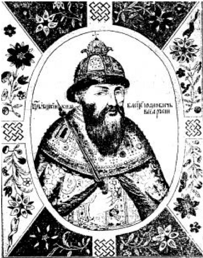
Fot. 5. Wasyl Szujski. Portret zamieszczony w rosyjskim wydaniu książki Z. Librowicza, Car w niewoli , Petersburg 1904.

w dolnej części zamku „przy zapuszczonej plantacji winorośli” i z widokiem na pobliskie zarośla po prawej stronie od wejścia na zamek, w pobliżu wrót zamkowych i mostu zwodzonego 19 . Jedno ze źródeł podaje, że carewicz wkrótce po przybyciu do Gostynina zaczęli szybko chudnąć. Przyczyniła się do tego tęsknota za ojczyzną, za utraconą wielkością i szczęściem 20 .