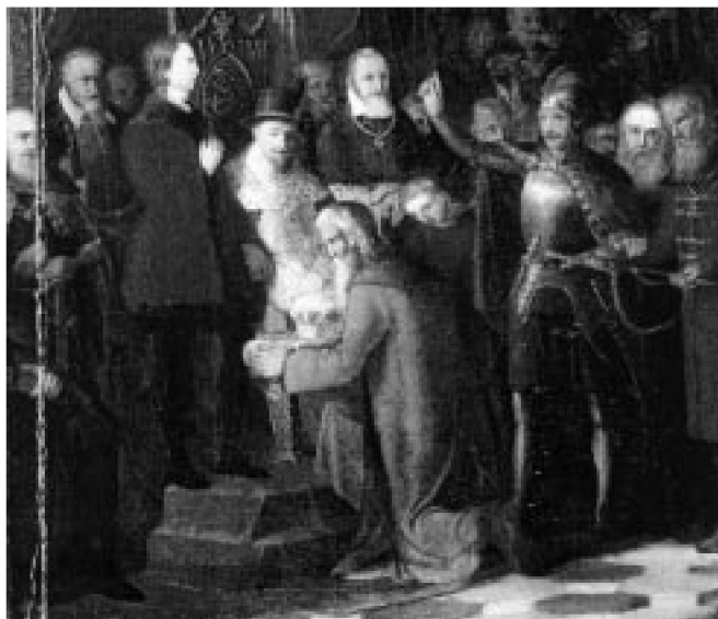
Fot. 3. Źródło: Reprodukacja obrazu Jana Matejki „Carowie Szujscy wprowadzeni przez Żółkiewskiego na sejm warszawski przed Zygmunta III”

jechały karety, w których siedzieli N. Szein i arcybiskup smoleński Sergiusz oraz inni smoleńczanie”. Gdy orszak zatrzymał się przed zamkiem, Żółkiewski wysiadł z karety, podszedł do cara, podał mu rękę i wprowadził wraz z bratem na zamek. W szczelnie wypełnionej izbie senatorskiej czekał król Zygmunt III Waza z dostojnikami. Tu pojmany car z braćmi, pętając na kolanach i czołem bijąc z wielkim uniżeniem prosił o miłosierdzie. Twarz Szujskiego pokryła się wy piekami upokorzenia i bezsilnej furii. U jego stóp złożono carskie chorągwie. Jak zanotował kronikarz „było to spectaculum dziwne y commiserabile” 13 .