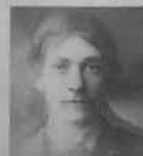
From 6 Members of same Family Male & Female.