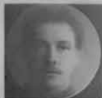
23 Cases. Royal Engineers. 12 Officers. 11 Privates