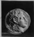
Alexander the Great From 6 Different Medals.