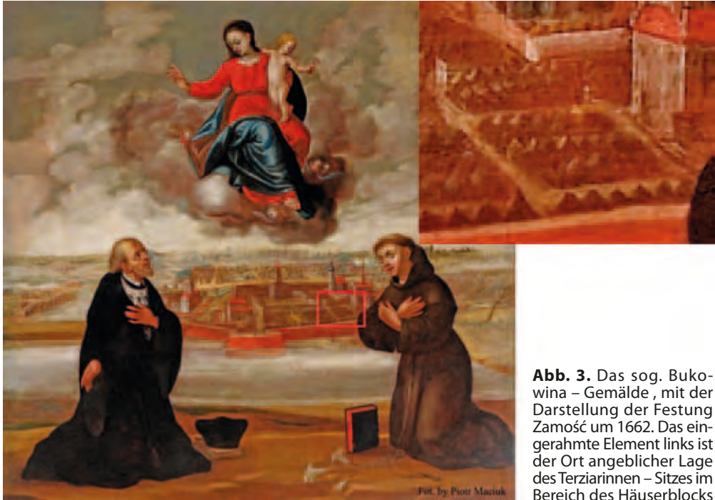
Abb. 3. Das sog. Bukowi-na – Gemälde , mit der Darstellung der Festung Zamość um 1662. Das eingerahmte Element links ist der Ort angeblicher Lage des Terziarinnen – Sitzes im Bereich des Häuserblocks XII.