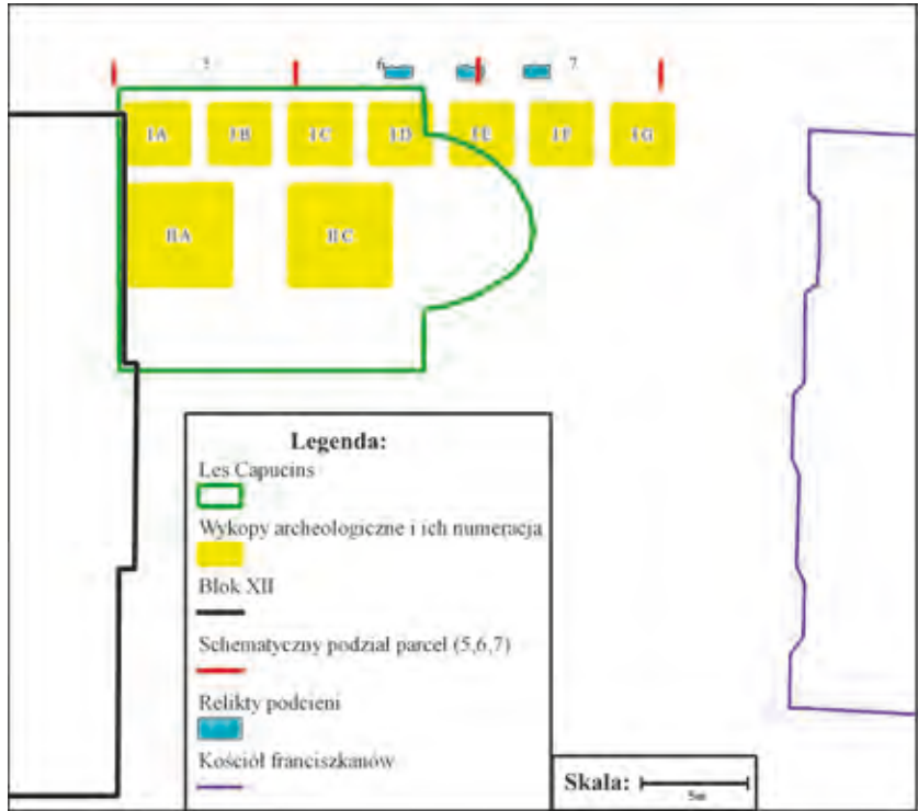
Abb. 4. Die Gesamtzusammenstellung der Umriss von Teilen der gegenwärtigen Architektur am Platz hinter dem Häuserblock XII. Die Reichweite der archäologischen Schnitte aus dem Jahr 1975, ergänzt mit den Relikten freigelegter Bogengänge und schematischer Reichweite der Grundstücke 5, 6 und 7 in Verbindung mit dem Objekt Les Capucins aus dem Jonsac – Plan. Methode: Georeferenc Q-GIS 1.7.1.

Ryc. 4. Zestawienie zbiorcze obrysów części architektury współczesnej przy placu za blokiem XII. Zasięg wykopów archeologicznych z roku 1975, uzupełniono reliktaami odsłoniętych podziemi, oraz schematycznymi zasięgami parcel 5, 6 i 7 w korelacji z obiektem Les Capucins z planu Jonsaca. Metoda wykonania: Georeferencer Q-GIS 1.7.1.