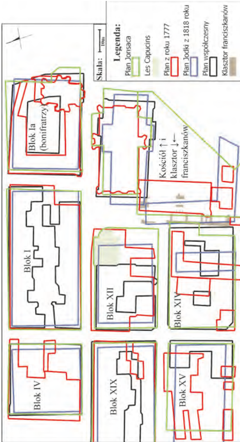
Abb. 2. Die Gesamtzusammenstellung der Umrisse ausgewählter Pläne der Altstadt in Zamość, auf denen sein Südostteil geschildert, und mit Relikten der freigelegten Architektur des Franziskanerklosters bereichert wurde. Methode: Georeferenc Q-GIS 1.7.1.