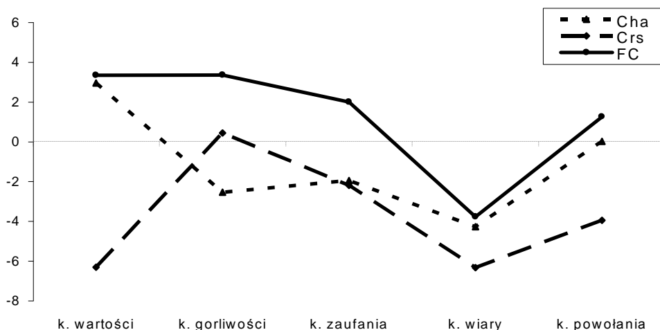
Wykres 2. Poczucie zmiany siebie w skalach Cha, Crs i FC w grupach wyodrębnionych z uwagi na typ kryzysu

Obecność mniej lub bardziej intensywnego momentu niepewności, czy też nieadaptacyjności podczas formacji zakonnej w znaczącym stopniu modyfikuje proces nabywania kompetencji do życia zakonnego. Treściowa specyfika obszaru, który podlega kryzysowi, wprowadza dodatkowe zróżnicowanie w zakresie poczucia zmiany w obrazie siebie, w procesie formacyjnym.