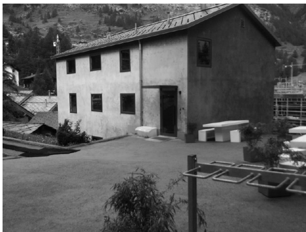
Rycina 2. Jeden z budynków noclegowych w schronisku w Zermatt

W większości schronisk można płacić kartami kredytowymi i jest to niemożliwe tylko w czterech schroniskach sezonowych. Opłaty za noclegi też są zróżnicowane w poszczególnych schroniskach i najczęściej trzeba zapłacić w schronisku w Davos, gdzie bez zniżki jeden nocleg kosztuje 53,90 CHF; następnie w Pontresina, gdzie zapłacimy najczęściej, tj. 54 CHF; St. Moritz – 53 CHF oraz w Zermatt – 51,10 CHF. W szczycie sezonu zapłacimy w tych schroniskach jeszcze więcej, a mianowicie w Davos – 64,50, St. Moritz – 61,50, a w Valbella-Lenzerheide aż 118 CHF.