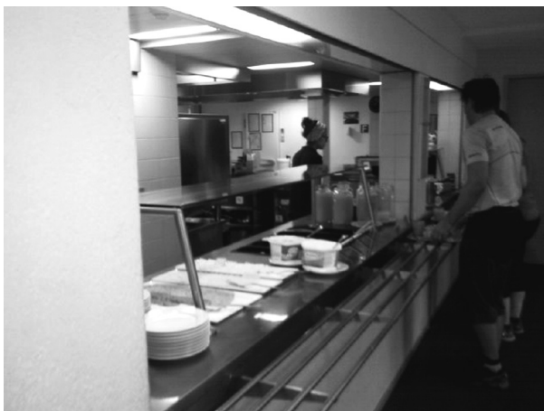
Rycina 1. Ciąg obsługi kuchennej w schronisku

Godziny otwarcia recepcji to od 7.00 do 10.00 oraz od 16.00 do 22.00.