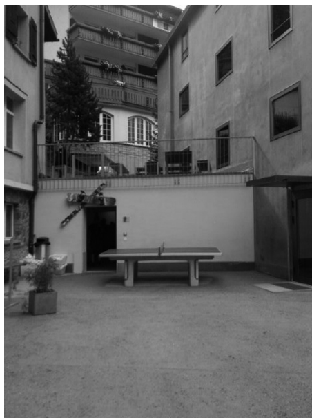
Rycina 3. Miejsce przeznaczone do rekreacji sportowej

Zdecydowana większość schronisk posiada własne parkingi, których nie ma tylko w 11 schroniskach. Do wszystkich schronisk można dojechać pociągiem, a dojazd z dworca kolejowego do schronisk wynosi od kilku minut do pół godziny. Do dużej liczby schronisk można dodatkowo dojechać autobusem lub tramwajem, a do kilku można również dopłynąć statkiem.