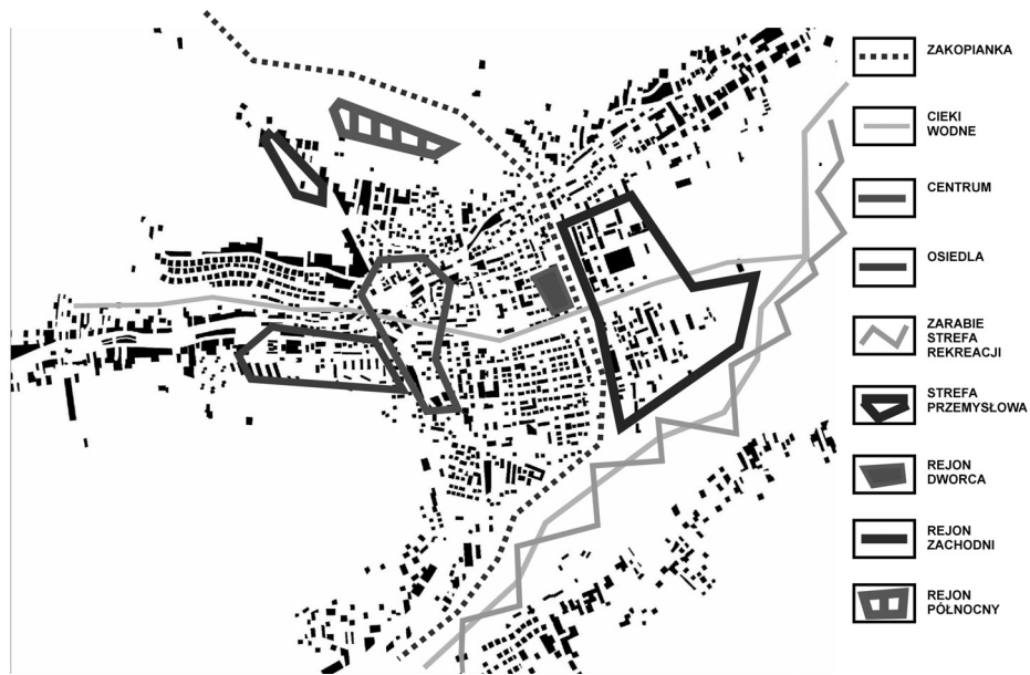
Rys. 1. Schemat obszarów działań inwestycyjnych w Myślenicach