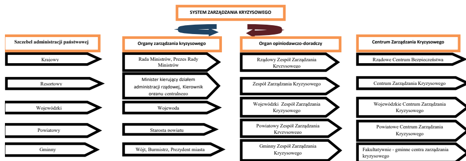
Rys. 2. Szczebłowy system ZK