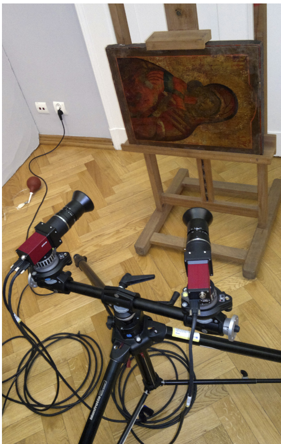
10. Badanie XVIII-wiecznej ikony za pomocą Cyfrowej Korelacji Obrazów – nowej metody badań nieinwazyjnych (2011)