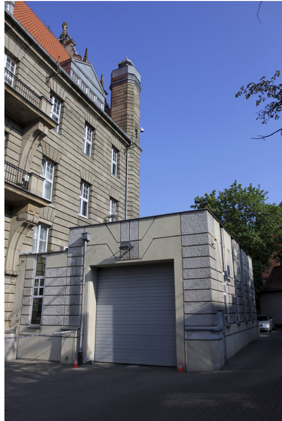
3. Tzw. przeładunek, w pełni zmechanizowana śluza w formie przybudówki (2015)