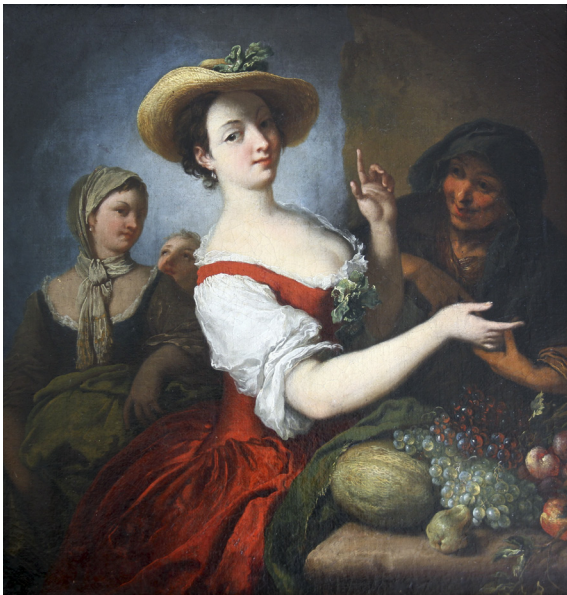
8. Christian Wilhelm Ernst Dietrich zw. Dietricy (1712–1774), Alegoria (Cztery etapy życia kobiety) , olej na płótnie (2015)