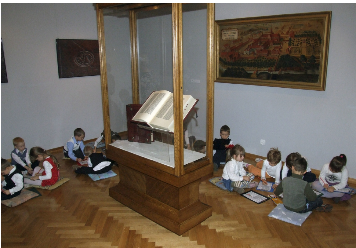
12. Zajęcia z przedszkolakami na wystawie „Galaktyka Gutenberga” (2008)

12. Lessons with kindergarten pupils at the „Gutenberg’s galaxy” exhibition (2008)