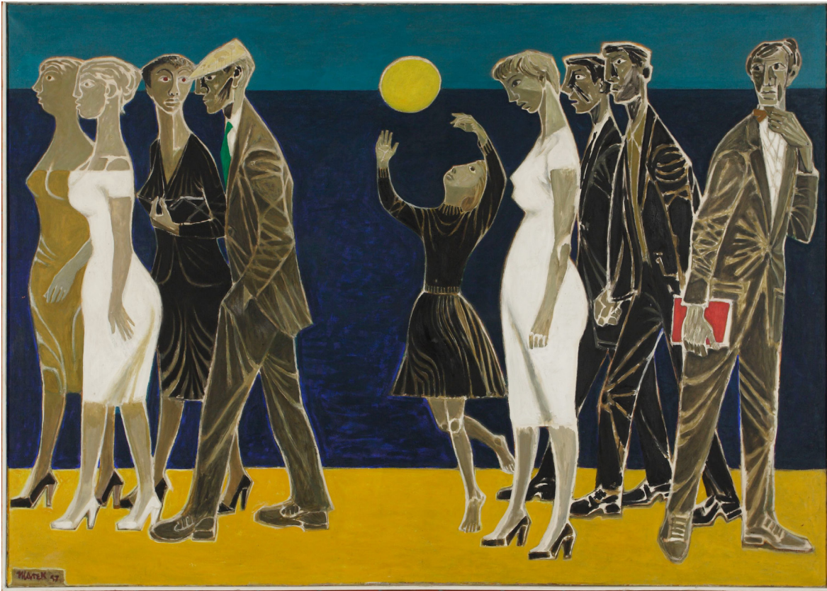
9. Marek Żuławski (1908–1985), Nadmorska promenada , 1957, olej na płótnie (2008)