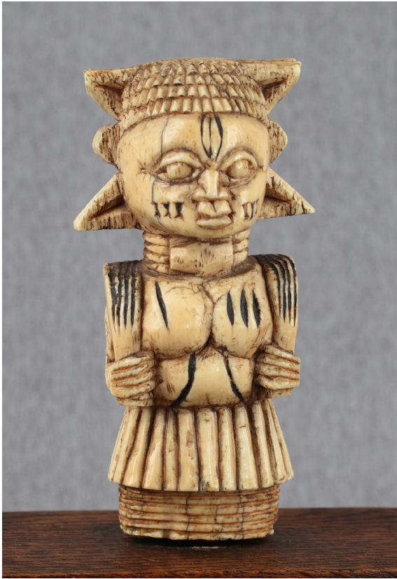
7. Statuetka urzędnika, królestwo Beninu, Nigeria, XVII/XVIII w., kość słoniowa – z kolekcji Aleksandra Wernera (2005)