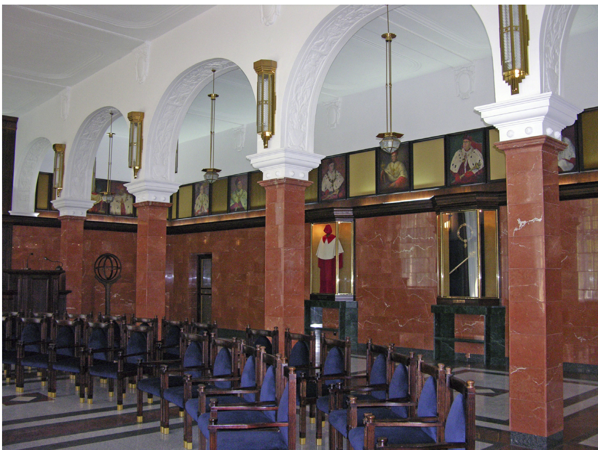
4. Sala Rektorska z prezentacją pocztu portretowego Rektorów UMK, insygniów i tog (2009)