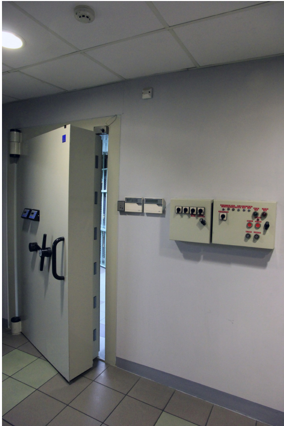
2. Drzwi dawnego skarbcza NBP, obecnie magazynu zbiorów MUT (2015)

2. Doors of the former treasury of the National Bank of Poland, currently storage for collections of the University Museum in Toruń (2015)