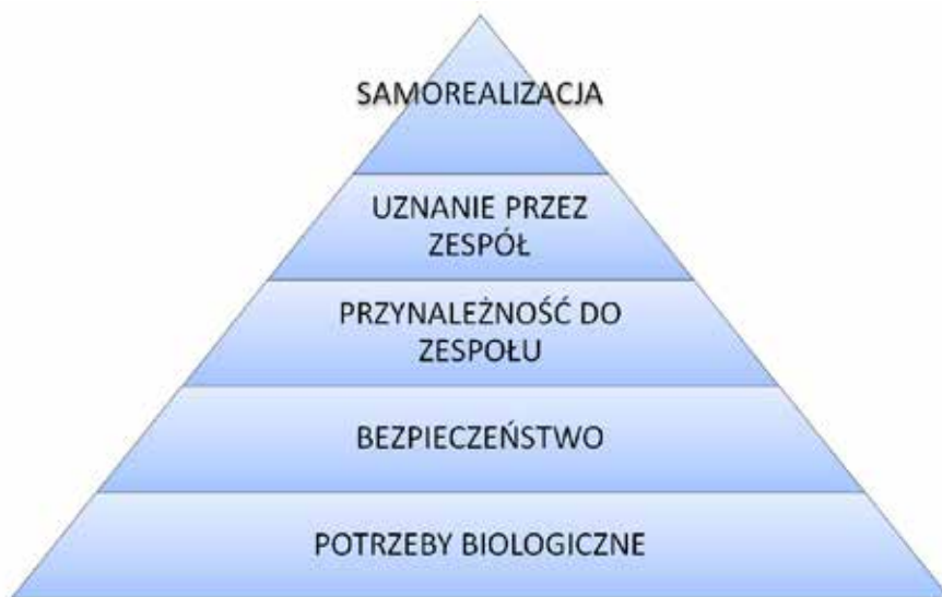
Rys.2. Piramida potrzeb Maslowa