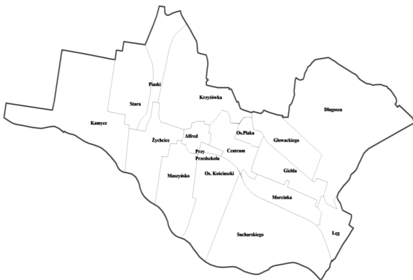
RYSUNEK 2. Podział miasta Wojkowice na obszary badań

W Wojkowicach wydzielono siedemnaście jednostek przestrzennych – podziału dokonano z uwzględnieniem więzi społecznych. Delimitacja jednostek była oparta częściowo na granicach okręgów wyborczych. W ten sposób uzyskano podział nawiązujący do dokumentów urzędowych i utrwalony w świadomości mieszkańców. Wojkowice reprezentują nieregularny układ miasta. Wynika to z żywiołowego uprzemysłowienia. Na stary układ wiejski nałożyły się zaplanowane w pierwszej kolejności osiedla robotnicze w rejonie byłej KWK „Jowisz” i ul. Morcinka, a następnie w innych rejonach miasta. Żywiołowe procesy urbanizacji, przejawiające się budową nowych osiedli robotniczych, utworzyły odrębne jednostki funkcjonalno-przestrzenne bez wyraźnego centrum miasta.