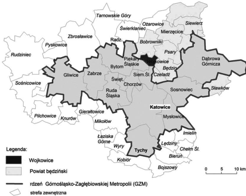
RYСУNEK 1. Położenie Wojkowic

Gmina Wojkowice leżąca w bezpośrednim zapleczu rdzenia nowo utworzonej Górnośląsko-Zagłębiowskiej Metropolii jest klasycznym przykładem lokalnego ośrodka, który borykał się przez wiele lat ze skutkami transformacji społeczno-gospodarczej na skutek restrukturyzacji przemysłu ciężkiego. Dzisiejszy efekt problemów w mieście po części to koszty restrukturyzacji gospodarki, a więc koszty zmian ustrojowych i systemu transformacji (Zuzańska-Żyśko, 2006, s. 207).