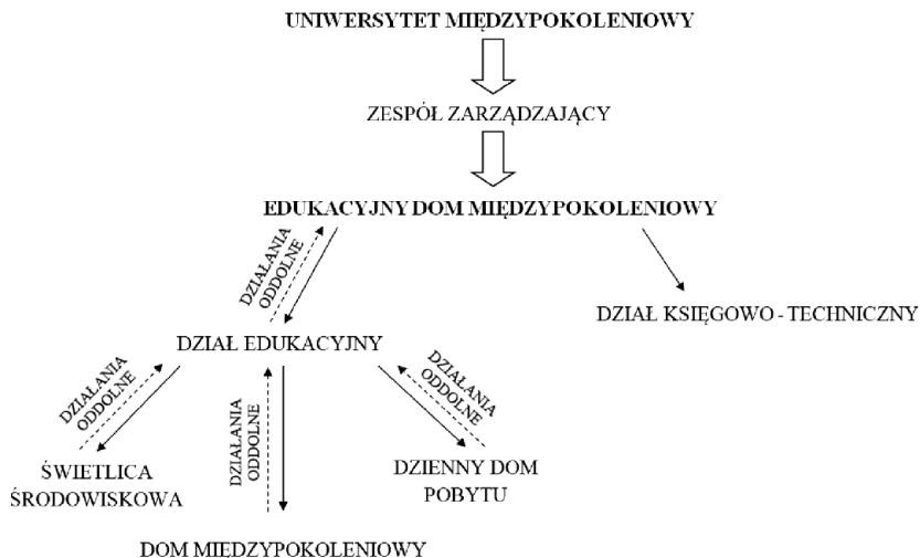
SCHEMAT 1. Struktura organizacyjna edukacyjnego domu międzypokoleniowego