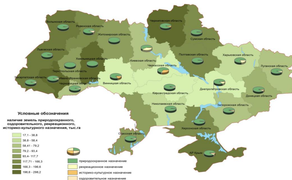
Рис. 2. Структура и наличие земель природоохранного, оздоровительного, рекреационного и историко-культурного назначения в регионах Украины

На современном этапе развития рыночной экономики приоритетности приобретает построение современных земельных отношений и поиск соответствующих институциональных средств по их поддержке. В таком ключе следует обратить внимание на капитализацию земель, где земельно-ресурсный потенциал необходимо рассматривать как стоимость, приносящая прибавочную стоимость. При этом принципиальное значение приобретает управление этой силой, и в частности процессом воспроизведения стоимостей. Именно поэтому в данном контексте следует обратить внимание на капитализацию земель рекреационных территорий. В современных условиях формирования и развития рекреационных территорий, где проходит свободное перемещение всех видов капитала, растут потребности в земельных ресурсах, поскольку в последние годы наблюдается общая закономерность увеличения интенсивности использования земель в местах концентрации туристическо-рекреационной деятельности. Процесс капитализации в современных рыночных условиях приводит к его наибольшей концентрации на тех территориях, где созданы наиболее выгодные условия для его расширенного