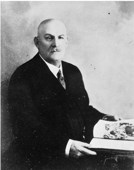
6. Aleksander Czołowski (1865–1944)

W latach trzydziestych Związek drukował z zapomóg Ministerstwa Wyznań Religijnych i Oświecenia Publicznego „Pamiętniki Muzealne” zjazdów wraz z ich protokołami, statutami i wygłoszonymi referatami, a także w latach 1934–1939 wydawał cyklicznie własny organ – „Komunikaty”. O zawartości tych ostatnich pisał Kazimierz Buczkowski: mają tam być wszystkie sprawy dotyczące muzeów, personalne, zmiany składów, posady i konkursy, itp. 16 . Postulowano także założenie rubryki poświęconej specjalistom zatrudnianym w poszczególnych muzeach 17 . Przystąpiono również do pracy nad podręcznikiem pt. Muzealnictwo redagowanym przez Stefana Komornickiego, który został częściowo wydrukowany tuż przed wojną, jednak jako całość ujrzał światło dzienne dopiero w 1947 roku. Powołano do życia biuro Związku, przez które przechodziły setki, a w okresie prowadzenia akcji na rzecz bezrobotnych pracowników umysłowych, tysiące pism rocznie.