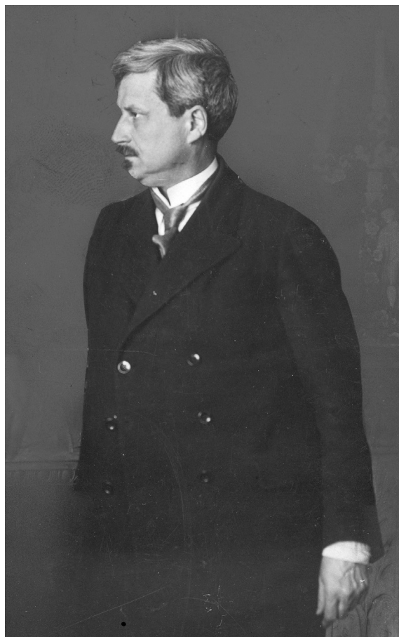
1. Feliks Kopera (1871–1952)

Wybuch I wojny światowej przekreślił wyraźnie zarysowane plany na przyszłość, a powrót do nich był, w wa-