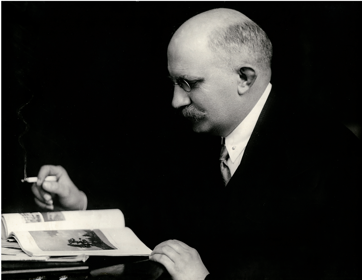
2. Nikodem Pajzderski (1882–1940)

Zjazd poznański przyjął wiele uchwał, których realizacja miała zająć długie lata, gdyż słabość muzeów opartych na nieustabilizowanych finansach, następnie kryzys ogólnoswiatowy i głębokie cięcia zobowiązań państwa wobec kultury w ogóle, doprowadziły do zaniku działania również Związku i jego zarządu, złożonego z dyrektorów zajętych ratowaniem instytucji. Jeszcze w latach 1922 i 1924 odbyły się zjazdy w Krakowie i we Lwowie – jednak później działalność Związku wygasła na okres 6 lat. Problemem był brak systematycznej pracy Związku między zjazdami i słabość zabiegów wprowadzających podjęte uchwały w życie. W odniesieniu do samych muzeów przestano liczyć na sancyjną rolę upaństwowienia muzeów, a zaczęto zabiegać o informowanie opinii publicznej na temat sytuacji muzeów, rozważając nawet sprzedaż zbiorów w celu ratowania najcenniejszych.