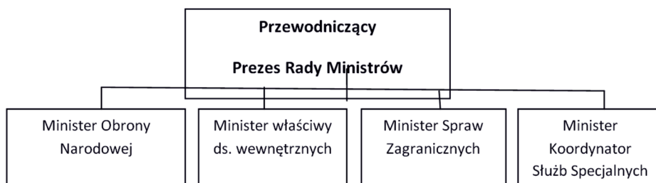
RYS 1. RZĄDOWY ZESPÓŁ ZARZĄDZANIA KRYZYSOWEGO

Obowiązujące na obszarze RP akty Prawne takie jak Konstytucja Rzeczypospolitej Polskiej a także przywoływana Ustawa o Zarządzaniu Kryzysowym zapewniają obywatelom bezpieczeństwo. Na terenie Rzeczypospolitej Polskiej zadania z zakresu zarządzania kryzysowego sprawuje Rada Ministrów. W sytuacjach, w których konieczne jest szybkie podjęcie decyzji zarządzanie kryzysowe sprawuje minister do spraw wewnętrznych, powinien on jednak niezwłocznie powiadomić o swoich decyzjach Prezesa Rady Ministrów. Wszelkie decyzje podjęte przez Ministra ds. wewnętrznych wymagają późniejszego zatwierdzenia przez Radę Ministrów. Organem opiniodawczym a także doradczym w kwestiach inicjowania i koordynowania przedsięwzięć podejmowanych w zakresie zarządzania kryzysowego jest Rządowy Zespół Zarządzania Kryzysowego (RZZK), w skład którego wchodzi: Prezes Rady Ministrów, który jest zarazem przewodniczącym RZZK, Minister Obrony Narodowej i minister właściwy do spraw wewnętrznych, Minister Spraw Zagranicznych; Minister Koordynator Służb Specjalnych – jeżeli został powołany.