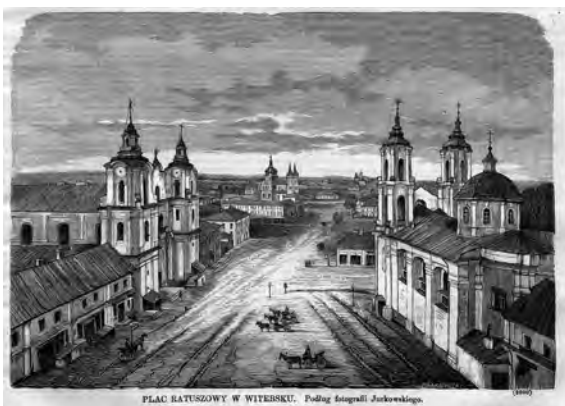
2. Plac Ratuszowy w Witebsku, po lewej kościół polski św. Antoniego, wg. „Kłosy”, 1873, t. XVII, nr 440, s. 368, drzeworyt wg. fotografii Zygmunta (vel Stanisława) Jurkowskiego