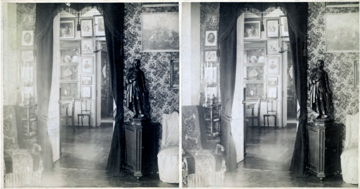
6. „Pokój bawialny” w domu Fedorowicza, Fototeka Instytutu Historii Sztuki UJ, sygn. OTPK41 Witebsk 005

6. „Living room” in Fedorowicz’s house, Photo Library of the Art History Institute of the Jagiellonian University, ref. OTPK41 Witebsk 005