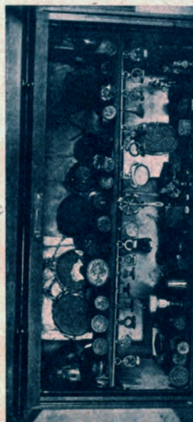
ZBIÓR PIECZĘCI W MUZEUM FIEDOROWICZA W WITEBSKU.

nej części traci na znaczeniu, w skutek zagubienia własnoręcznego spisu zabytków Fedorowicza, w którym było wskazane, gdzie