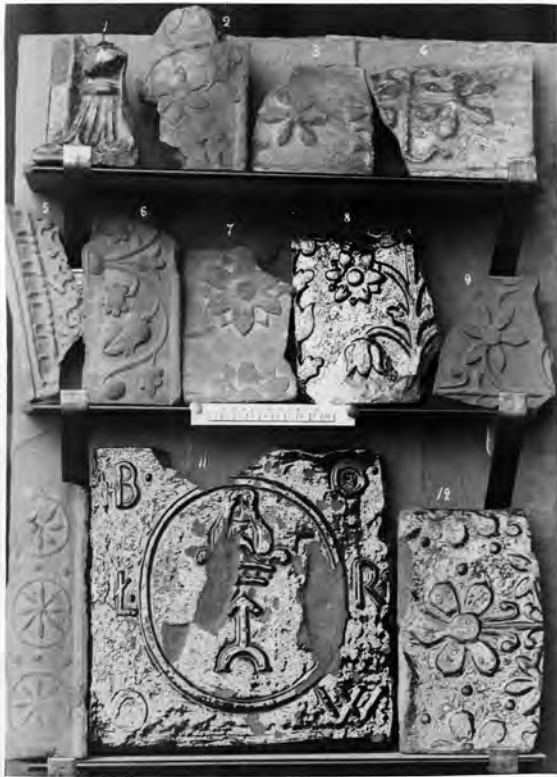
4. Kafle ze zbioru Fedorowicza, Fototeka Instytutu Historii Sztuki UJ, sygn. OTPK41 Witebsk 003

4. Tiles from the Fedorowicz's collection, Photo Library of the Art History Institute of the Jagiellonian University, ref. OTPK41 Witebsk 003