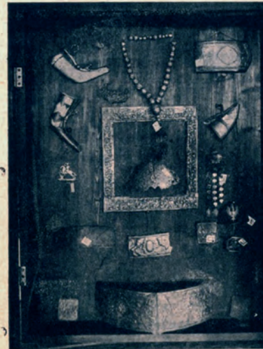
JEDNA Z GABLOT W MUZEUM WACŁAWA FEDOROWICZA W WITEBSKU.