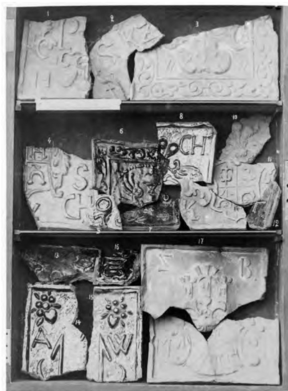
3. Kafle ze zbioru Fedorowicza, Fototeka Instytutu Historii Sztuki UJ, sygn. OTPK41 Witebsk 002