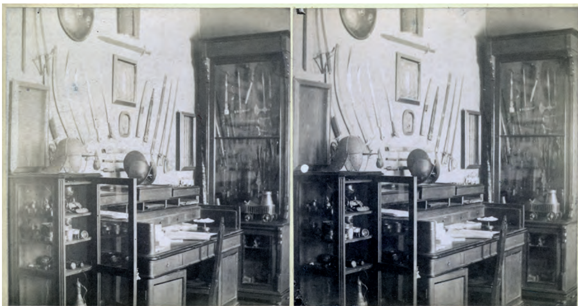
5. „Pokój do rozmów z klientami” w domu W. Fedorowicza, Fototeka Instytutu Historii Sztuki UJ sygn. OTPK41 Witebsk 004