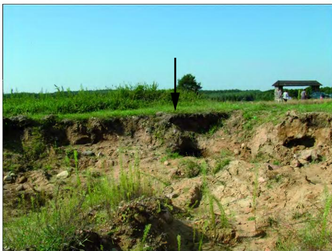
Ryc. 2. Sinoleka, pow. Mińsk Mazowiecki, stan. 1. Południowa ściana żwirowni z zaznaczoną lokalizacją grobu klozowego.