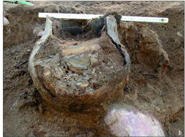
Ryc. 3. Sinołęka, pow. Mińsk Mazowiecki, stan. 1: a – profil grobu kloszowego, b – popielnica w trakcie eksploracji. Fig. 3. Sinołęka 1, distr. Mińsk Mazowiecki: a – cross-section of the cloche grave, b – the urn during exploration.

palcowe. Powierzchnia wewnętrzna jasnoszara, gładka. Wys. zachowana 42 cm, średn. brzuśca ok. 45–50 cm, dna 15 cm (Ryc. 4a).