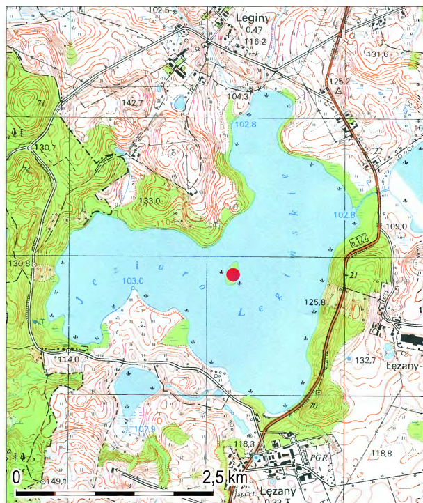
Ryc. 1. Lokalizacja stanowiska IX w Leginach, pow. Kętrzyn Fig. 1. Location of site IX at Leginy, distr. Kętrzyn

Fibula z Legin odpowiada 2. wariantowi 3. serii w klasyfikacji zapinek trójgrzebykowych T. Hauptmanna (1998, s. 167, ryc. 1). Jej całkowita długość wynosi 10 cm. Zapinka ma zredukowany grzebyk, mocno wydłużoną nóżkę, zaopatrzoną jest też w umieszczoną przy cylindrze płytę długości 6,2 cm i szerokości 1 cm; na obu końcach płyty znajduje się po jednym wielokątnym uszku z kolistym otworem o średnicy 0,4 cm. Na całej powierzchni płyta zdobiona jest ornamentem linii zyg-