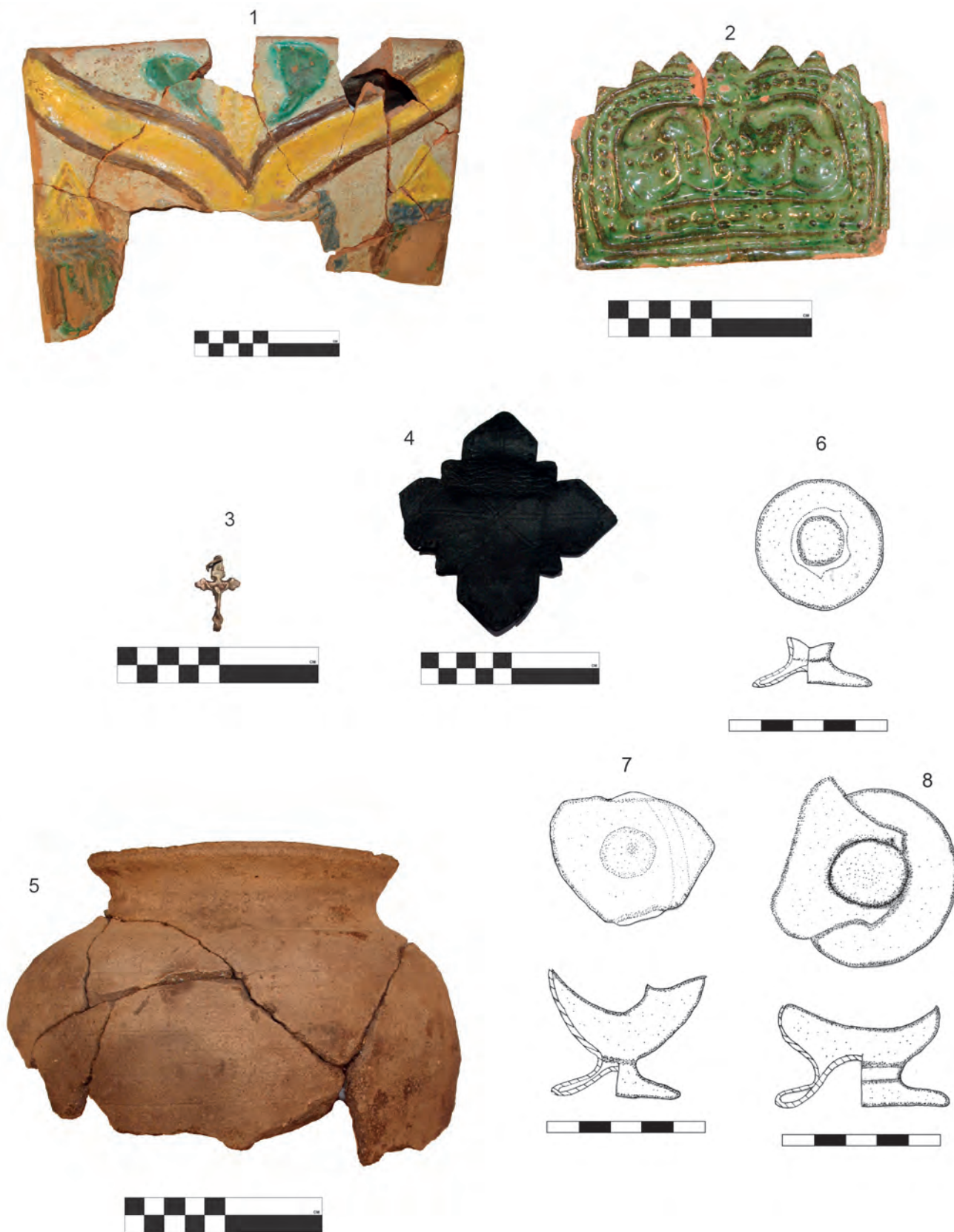
Ryc. 3. Dokumentacja rysunkowa i fotograficzna wybranego ruchomego materiału zabytkowego: 1 – fragment kafła kontynuacyjnego z ornamentem roślinnym (fot. P. Kocańda); 2 – kafel wieńczący, pokryty ornamentem roślinnym i zieloną polewą (fot. P. Kocańda); 3 – pozłacany krzyżyk (fot. P. Kocańda); 4 – skórzana klamra od pasa w kształcie krzyża równoramiennego (fot. P. Kocańda); 5 – wczesnośredniowieczne naczynie z obiektu nr 3 (fot. P. Kocańda); 6–8 – nóżki od pucharów dzwonowatych (rys. P. Gorazd-Dziuban)