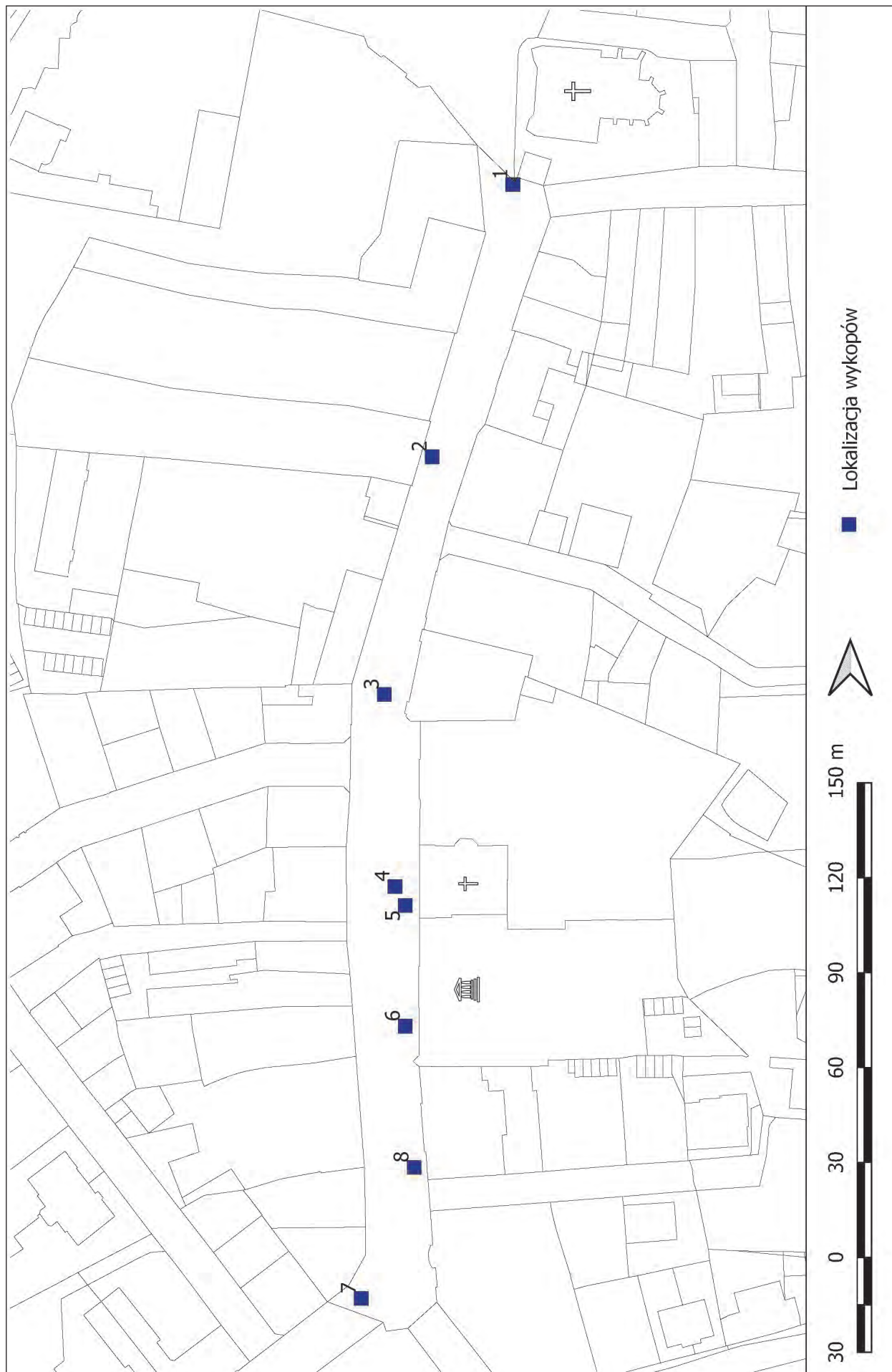
Ryc. 1. Lokalizacja wykopów archeologicznych na ulicy 3 Maja w Rzeszowie Abb. 1. Lage der Grabungsschnitte in der Straße 3-Maja in Rzeszów