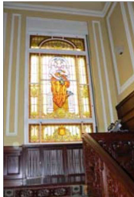
2. Rekonstrukcja witraża z przedstawieniem Flory w pałacu Biedermanna, aut. rekonstrukcji – Jan Dominikowski z WUOZ Łódź.

W referatach, poza prezentacją łódzkiej architektury rezydencjonalnej z przełomu wieków oraz przybliżeniem wyników najnowszych badań dotyczących jej twórców, poszukiwano odpowiedzi na pytania dotyczące pochodzenia występujących w tej architekturze form, stylów, motywów ikonograficznych i dekoracyjnych. Zastanawiano się, czy przywiązanie do stylów historycznych i odnoszenie się do znanych pierwowzorów