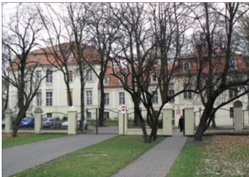
1. Pałac Biedermanna, siedziba Katedry Historii Sztuki i Kulturoznawstwa Uniwersytetu Łódzkiego, miejsce obrad w pierwszym dniu sesji. 1. The Biedermann Palace, seat of the Chair of the History of Art and Culture Studies at Łódź University, site of debates held during the first day of the session.

2. Reconstruction of a stained glass depiction of Flora in the Biedermann Palace, author of the reconstruction: Jan Dominikowski from WUOZ Łódź.