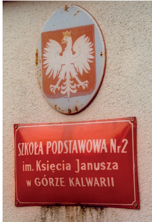
Fot. Piotr Piekarz