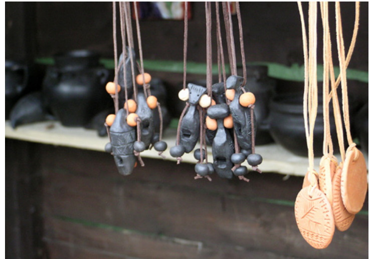
Ryc. 7. Materialne symulakry przeszłości. Kopie pradziejowych amuletów i gwizdków oferowane zwiedzającym na stoisku podczas Jarmarku Średniowiecznego w Chudowie w 2008 r.

Wizerunki przeszłości, kreowane podczas festynów archeologicznych, często przyjmują hybrydalną postać. W procesie tym zaobserwować można implozję (zawieszenie) kategorii przestrzeni i czasu (Dominiak 2004, 86). Przede wszystkim w efekcie hybrydyzacji wizerunków przeszłości dochodzi do zestawienia z sobą w jednym miejscu różnych elementów i przedstawień, nawiązujących do odległych od siebie czasowo i przestrzennie wydarzeń (np. mezolityczni łowcy współwystępujący obok średniowiecznej zielarki), do zaniku chronologicznych lub kulturowych granic prezentacji lub celowego ich zawieszania, co powoduje brak spójności i stapianie się wszystkiego w jedną, nierozróżnialną całość. Festyn pozwala bowiem na zestawianie z sobą znaków