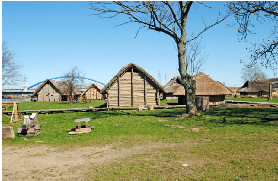
Fig. 1. An open air museum of Slavs and Vikings in Wolin – location of the annual Slavs and Vikings Festival

2007; Brzostowicz 2009). Festyny przyciągają licznych widzów, w tym głównie dzieci; ich sukces mierzony jest wysoką frekwencją odwiedzających, co ma stanowić dowód na to, że przeszłość może być prezentowana w atrakcyjny, angażujący i trafiający w gust współczesnego odbiorcy sposób.