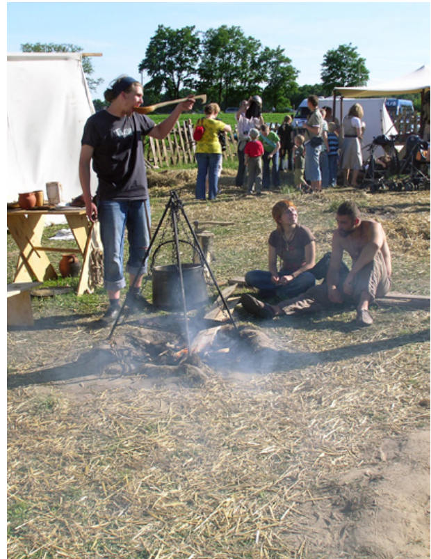
Ryc. 9. Dotknięcie przeszłości. Podczas festynu istnieje możliwość bezpośredniego kontaktu z przeszłością za pomocą zmysłów. Jarmark Średniowieczny w Chudowie w 2009 r.