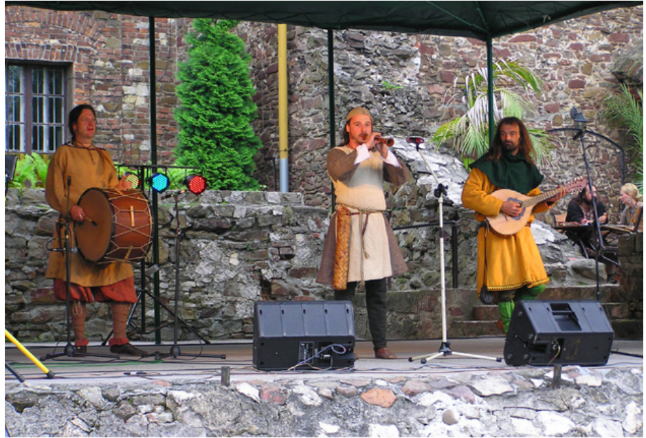
Fig. 12. A concert of the Fidelis band, playing old music. Cultural Heritage Days in the courtyard of Toszek Castle, 2010

Festyny obfitują też w wiele jarmarczno-odpustowych czy stricte ludycznych elementów, pozbawionych walorów edukacyjno-popularyzatorskich, dla których festyn stanowi jedynie atrakcyjną otoczkę czy „fabularny sztafaż” (Golka 2009, 66). Zaliczyć tu należy stoiska serwujące piwo, frytki, kielbasę, kaszankę z grilla lub słodkie wypieki, często w nieco bardziej wysublimowanej formie pod postacią staropolskiej czy pradziejowej „strawy” bądź „napitków”. W zakres tego rodzaju atrakcji wchodzi ponadto loterie fantowe, ozdabianie ciała pradziejowymi tatuażami, kąpiele w drewnianej balii, przeciąganie liny, pokazy sztucznych ogni, pokazy katowskie itd. (Ryc. 11). Całości obrazu dopełniają występy zespołów tanecznych czy zespołów grających muzykę dawną bądź folkową (Ryc. 12), kramy z pamiątkami i zabawkami dla dzieci, sprzedające m.in. plastikowe miecze, kusze bądź hełmy, stoiska twórców ludowych czy oferujące ekologiczną żywność. Stosunkowo rzadko, jednak zdarza się, iż nieopodal przygotowane są też dodatkowe atrakcje jak dmuchane zamki czy zjeżdżalnie bądź trampoliny dla najmłodszych. Postrzegając festyny z takiej perspektywy, należy oddać rację ich krytykom twierzącym, iż coraz częściej przyjmują one formułę wynikającą ze skrzyżowania idei pikniku i działkowego grillowania z pokazami historycznymi (Czubkowska 2006, 11).