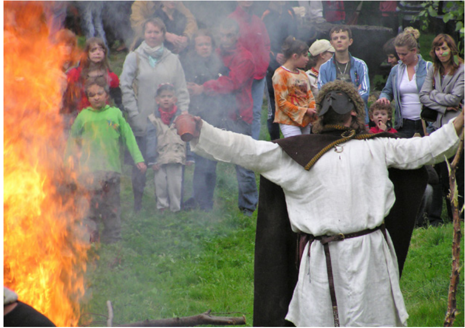
Fig. 4. Re-enactment of the early medieval trizna ritual – burial of a warrior. “An Ancient Tale” in Chudów in 2008.