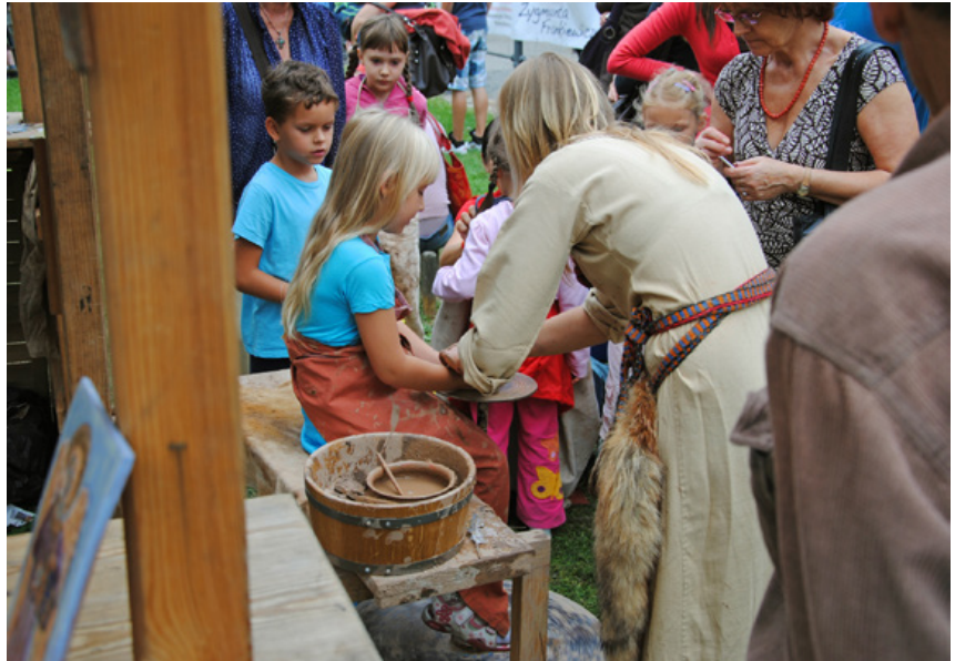
Fig. 5. During the festival there is an opportunity to manufacture prehistoric artefacts. Pottery-making during the Prince Siemowit Fair in Gliwice, 2011.

Ryc. 6. Rekonstrukcja średniowiecznego obozu. Stara Baśń w Chudowie w 2008 r.