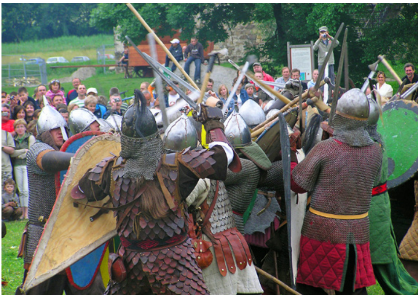
Ryc. 10. Inscenizacja bitwy. Stara Baśń w Chudowie w 2008 r.

Fig. 10. Re-enactment of a battle. “An Ancient Tale” in Chudów in 2008.