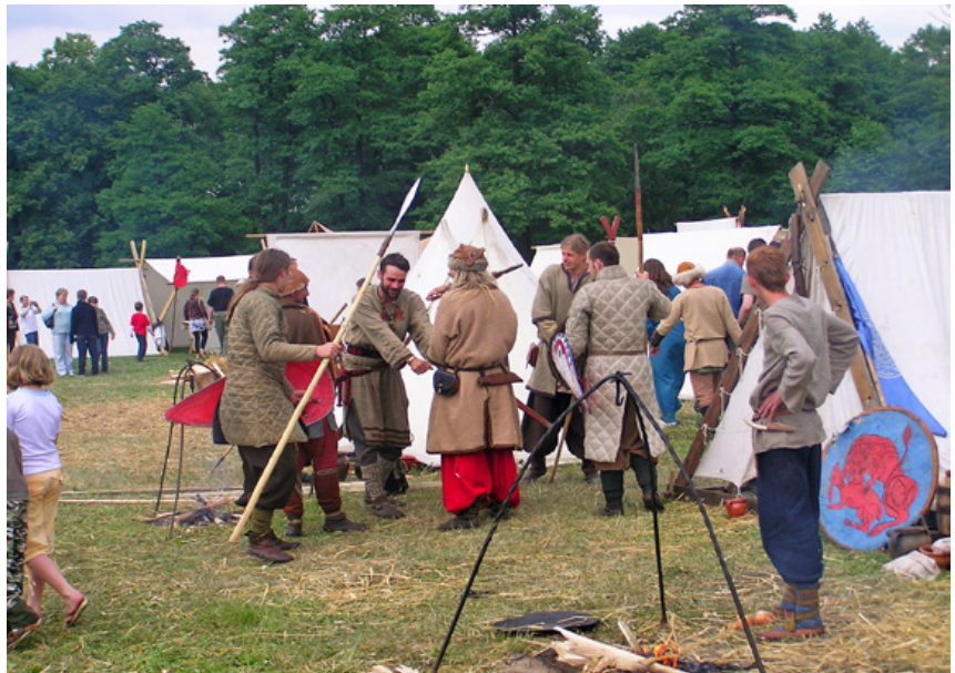
Fig. 6. Reconstruction of a medieval camp. "An Ancient Tale" in Chudów in 2008.

efektem łączenia go ze słowami komercja lub komercjalizm, czyli działalnością nastawioną wyłącznie na osiągnięcie jak największych zysków i korzyści, a także wszelkimi produktami, będącymi efektem takowych działań. Komercjalizacja uwypukla ekonomiczny aspekt produktów kulturowych, prowadząc do ich umasowienia, podkreślając jednocześnie, iż najważniejsza jest ich przystępność i atrakcyjność dla przeciętnego odbiorcy oraz zysk, jaki przynoszą. Co istotne, jej poszczególne aspekty odnoszą się również do sfery dziedzictwa kulturowego i archeologicznego, dotycząc konwersji dóbr kulturowych w zasoby (Nieroba, Czerner, Szczepański 2009, 32-33).