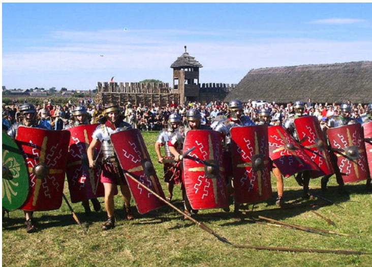
Ryc. 8. Przeszość jako fotomontaż. Legioniści rzymscy w scenarii rekonstrukcji osady obronnej w Biskupinie podczas XII festynu archeologicznego „Rzymianie i barbarzyńcy” w 2004 r.