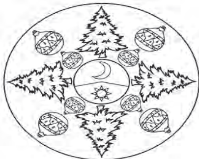
Rys. 2. Mandala na Boże Narodzenie 5

zaproponować uczniom pracę z mandalami tematycznymi, np. mandalami andrzejkowymi, mikołajkowymi, bożonarodzeniowymi, wielkanocnymi, mandalami na pierwszy dzień wiosny czy mandalami z symbolami narodowymi (por. Łazarz 2007, Kraszewska 2006b). Pomogą one zgromadzić dzieciom odpowiednie słownictwo i zapamiętać najważniejsze wiadomości.