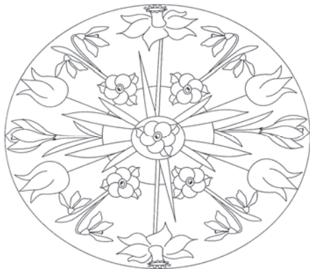
Rys. 3. Przykład mandali tematycznej 6

taką mandalę, intensywnie pracuje, wkłada w pracę więcej wysiłku i zaangażowania. Nie tylko rysuje obrazek mandaliczny, ale i odczytuje zapisane na nim wyrazy, tworzy do nich rodzinę wyrazów, układa z nimi zdania lub całe historyjki. Na podstawie takich mandali mogą również powstawać opisy, opowiadania, baśniowe opowieści, projekty.