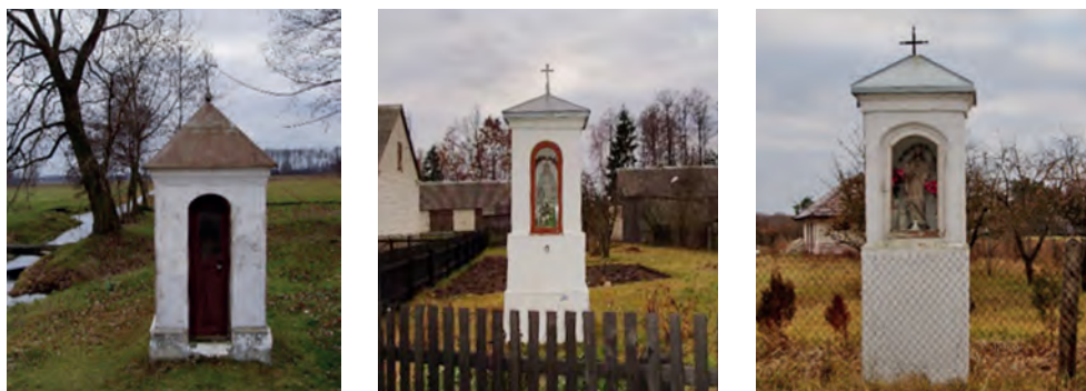
Ryc. 2. Chudek – kapliczki murowane z początku XX w.

Wioski zadrzewione były brzezina, sosną i olbrzymimi jałowcami, które wyrastały tu jak drzewa. W niektórych wioskach, położonych w miejscowościach błotnistych, ulice były brukowane, o ile pozwalała na to bliskość kamienia, którego w Puszczy było mało. Przewagę jednak stanowiły wioski, w których piasek sięgał po kolana, na którym jednak po największej nawet ulewie błota nigdy nie było. Często domy budowane były bez fundamentów, z powodu wspomnianego już braku lub niewielkiej ilości w bezpośrednim sąsiedztwie kamienia. Niektóre wioski kurpiowskie przy wjeździe miały wrota, tzw. kołowrot. W razie potrzeby lub na noc były zamykane ze wszystkich stron, tworząc zamkniętą całość (ryc. 3).