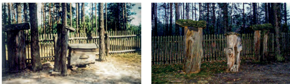
Ryc. 7. Skansen Kurpiowski w Kadzidle – pasieki

Na początku XIX w. sformułowane zostało pojęcie zabytku na określenie takiego obiektu dawnego, który z różnych powodów wart jest zachowania. W XX w. zabytek uznano za dobro kultury. Pojedyncze obiekty, bądź całe zespoły uznane za zabytek, stały się przedmiotem ochrony i zainteresowania, również dydaktycznego. Większość jednak obiektów, które z różnych powodów nie zostały uznane za zabytkowe, popadły w zapomnienie. Pejoratywnie traktowane w okresie powojennym obiekty mieszkalne związane z kulturą regionalną, przetrwały do dnia dzisiejszego wyłącznie z powodu ubóstwa kurpiowskiego społeczeństwa wiejskiego. Zcentralizowanie państwa, również w sprawach dotyczących ochrony zabytków oraz decyzji, które obiekty należy za nie uznać, spowodowały zmniejszenie zainteresowania tą problematyką ludności lokalnej. Zabytki sztuki i architektury regionalnej, lokalizowane w muzeach etnograficznych, skansenach czy izbach pamięci, były traktowane jako obiekty martwe, dowody minionych czasów, kojarzone z niskim standardem i gorszym życiem.