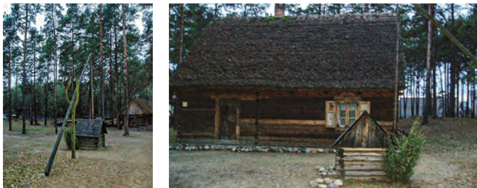
Ryc. 6. Skansen Kurpiowski w Kadzidle – studnie