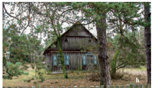
Ryc. 8. Przykłady zachowanych budynków drewnianych w krajobrazie kurpiowskim: a) Grabowo – chata z początku XX w., b) Grabowo – zabudowania gospodarcze XIX/XX w., c) Olszewka – chata z końca XIX w., d) Olszewka – zagroda z końca XIX w., e) Łęg Starościński – chata z 1931 r., f) Kierzek – chata, ok. 1920 r., g) Brodowe Łąki – ruina chaty z II poł. XIX w., h) Gleba – chata z początku XX w.