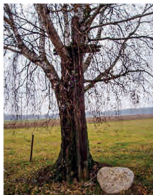
Ryc. 9. Krzyże przydrożne charakterystyczne dla krajobrazu kurpiowskiego