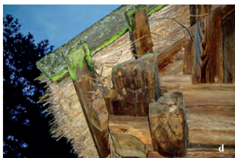
Ryc. 4. Skansen Kurpiowski w Kadzidle: śparogi (a), okiennice (b), drzwi (c), dach (d)

Najbardziej ozdobną częścią chaty kurpiowskiej był szczyt, zwrócony do ulicy. Szczyt ten przedzielony był zwykle na dwie części: niższą składającą się z desek pionowych oraz wyższą z desek ułożonych na krzyż lub w różne wzory, dowolnie lub symetrycznie. Deski przybijane były gwoździami, na które często nakładano świecące kwadratowe blaszki. Na szczycie często można było spotkać zawieszony krzyż lub obrazek Matki Boskiej. Często też wykonywano otwory do przewietrzania i oświetlenia strychu. Zazwyczaj belka szczytowa była rzeźbiona lub wycinana w różne wzory, nieraz skomplikowane [Chętnik 1915].