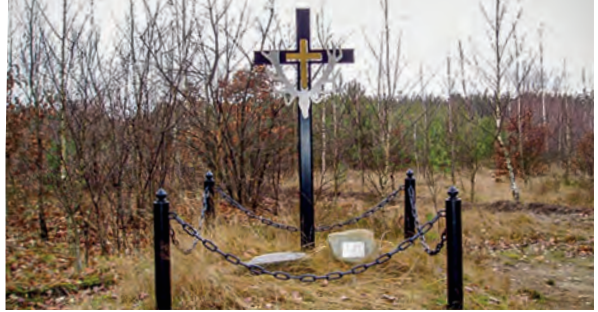
Ryc. 10. Współczesny krzyż przydrożny z początku XXI w. z napisem Boże błogosław wodom i lasom , okolica rezerwatu Olsy Płoszyckie, gmina Lełisz

Dawne kapliczki i krzyże cechowała oryginalność i architektura wyróżniająca je spośród innych regionów. Niewiele z nich przetrwało w niezmienionej formie do dnia dzisiejszego. Większość została zamieniona w okresie powojennym przez nowe, często seryjnie produkowane krzyże, niewyróżniające się cechami kurpiowskim (ryc. 10).