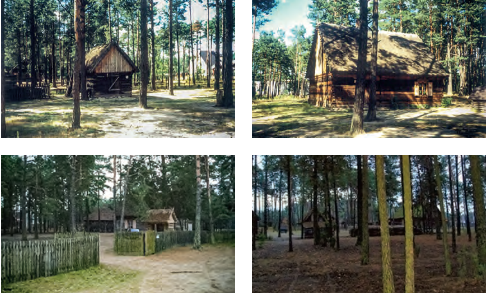
Ryc. 1. Skansen Kurpiowski w Kadzidło – budynki

Formy tradycyjnej architektury regionu kurpiowskiego są nierozdzielnie związane z charakterem krajobrazu otwartego Kurpiowszczyzny. Są symbolem kulturowej odrębności regionu, lokalnej tożsamości. Naturalne odizolowanie badanego obszaru, konserwatyzm społeczności wiejskich, i tym samym mniejsza podatność na zmiany, pozwoliły zachować tradycyjne metody budowania i użytkowania budynków.