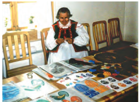
Ryc. 11. Dodatkowe zajęcia zarobkowe Kurpiów prezentowane w Skansenie Kurpiowskim w Kadzidle