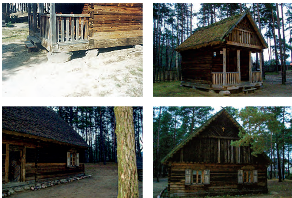
Ryc. 3. Skansen Kurpiowski w Kadzidle – budynek

Wioski zadrzewione były brzezina, sosną i olbrzymimi jałowcami, które wyrastały tu jak drzewa. W niektórych wioskach, położonych w miejscowościach błotnistych, ulice były brukowane, o ile pozwalała na to bliskość kamienia, którego w Puszczy było mało. Przewagę jednak stanowiły wioski, w których piasek sięgał po kolana, na którym jednak po największej nawet ulewie błota nigdy nie było. Często domy budowane były bez fundamentów, z powodu wspomnianego już braku lub niewielkiej ilości w bezpośrednim sąsiedztwie kamienia. Niektóre wioski kurpiowskie przy wjeździe miały wrota, tzw. kołowrot. W razie potrzeby lub na noc były zamykane ze wszystkich stron, tworząc zamkniętą całość (ryc. 3).