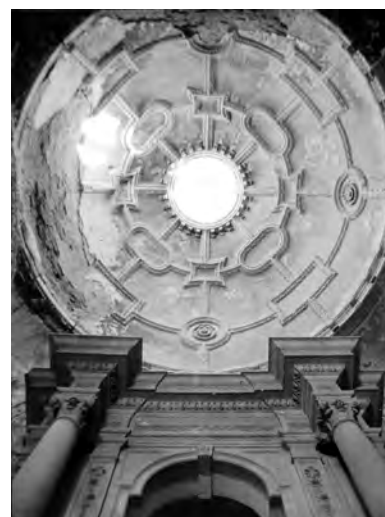
21. Kamieniec Podolski, kościół podominikański, kaplica Matki Boskiej Różańcowej, 1618 r., dekoracja stiukowa kopuły, przed pracami konserwatorskimi. 1997 r.

Obok rozpoznania konserwatorskich poprzedzających podjęcie prac w Dobromilu i Kutach 31 , dokonano dalszych rozpoznania zabytków w 14 miejscowościach. W roku 1996 wykonano ekspertyzę w drewnianym kościele w Wołpie, dotyczącą posadowienia zagrożonego ołtarza głównego z 1634 r. 32 , ekspertyzę stanu zawilgocenia kościoła w Różanej 33 , wstępny program pierwszego etapu prac konserwatorskich malowideł w kościele w Hołobach wraz z ich kosztorysem 34 , zaś w październiku tegoż roku przeprowadzono rozpoznanie sześciu drewnianych kościołów w Żytomierskim 35 oraz zabytków w Połonnem i Zasławiu (Izasław). W 1997 r. na prośbę parafii w Czortkowie rozpoznano stan zachowania dawnego kościoła parafialnego w Jagielnicy 36 , wyposażenia kościoła parafialnego w Rawie Ruskiej oraz stan zachowania czterech ogromnych