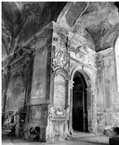
22. Kamieniec Podolski, kościół poddominikański, kaplica Matki Boskiej Różańcowej, wejście z korpusu nawowego, dekoracja 1737–1755, przed pracami konserwatorskimi.

W okresie sprawozdawczym dofinansowaniem prac konserwatorskich, głównie budowla-