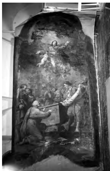
7. Łuck, katedra. Obraz „Wniebowzięcie Matki Boskiej”, ok. poł. XVIII w., przypisywany mal. Tadeuszowi Kuntzemu, stan przed pracami konserwatorskimi. Fot. I. Malczewska, 1997 r.

ku z projektowanym odnowieniem wnętrza kościoła 15 . Kons. Krzysztof Kudelski odkrył następujące fragmenty dawnych malowideł: trzy zacheuski różniące się formą (dwa jednakowe na filarach chóru muzycznego, zapewne z czasu kolejnej konsekracji kościoła dokonanej w 1753 r. przez arcybiskupa Wacława Hieronima Sierakowskiego i trzeci na pd. ścianie nawy, wcześniejszy, zapewne z XVI wieku, może z początku XVII w.); słabo czytelny fragment figuralnego malowidła, usytuowanego tuż przy ambonie i określonego przez K. Kudelskiego jako św. Piotr łowiący siecią ryby, zapewne z XVII w. — dwa napisy znajdujące się nad wnękami ponad chórem muzycznym: od pd. „S. LAURENTIUS MARTYR” i od pn. „S. MICHAEL ARCH-ANGELUS”; wic roślinną na pilistrze fryzu arkadowo-wnękowego przy postaci św. Władysława z Gielniowa 16 . Na spotkaniu komisji konserwatorskiej powołanej