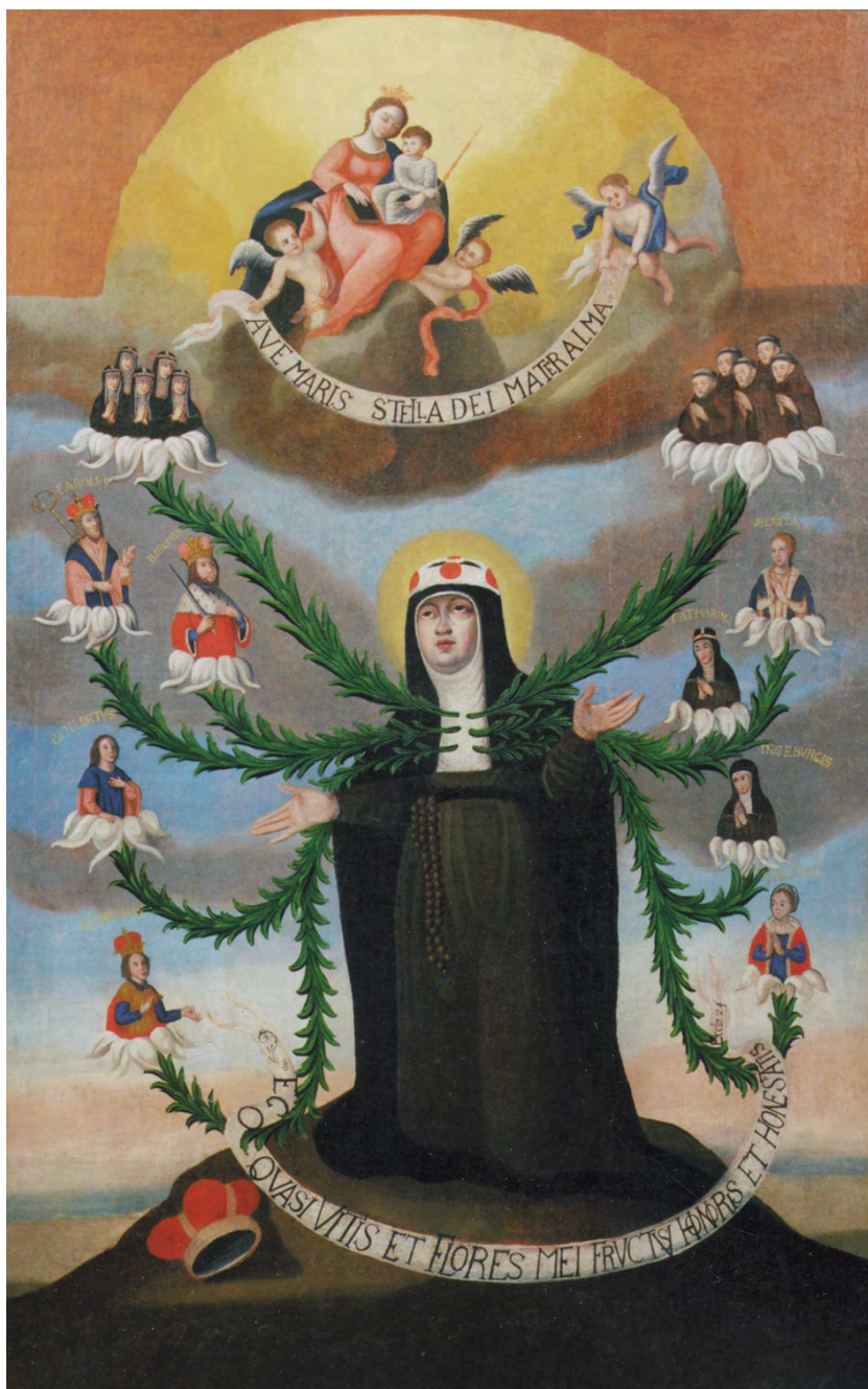
1. Grodno, kościół pobrygidkowski, obecnie ss. nazaretanek. Obraz „Drzewo genealogiczne zakonu św. Brygidy”, zapewne 1 poł. XVIII w., po pracach konserwatorskich. Fot. A. Stasiak, 1996 r.