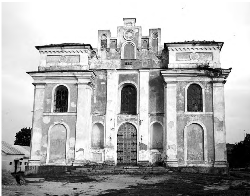
23. Braclaw, kościół parafialny, ukończony 1884 r., elewacja frontowa. Fot. J. Skrzypczyk, 1996 r.

nych, objęto 12 kościołów na Białorusi, Litwie i Ukrainie w następujących miejscowościach: z funduszy Stowarzyszenia — Bolechów, Braclaw, Kamieniec Podolski, Kołomyja, Nowy Zawód (kościół drewniany), Połuknie (kościół drewniany), Różana; z funduszy Biura Pełnomocnika za pośrednictwem Ośrodka — Brzozdowce, Hołoby (il. 26), Nieśwież, Nowogródek (il. 27), Rymacze i drewniany dwór w Poszeszuwiu na Litwie.