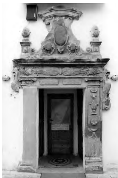
10. Grodno, kościół pobrygidkowski, obecnie ss. nazaretanek, portal boczny, 1634–1642, po pracach zabezpieczających. Fot. J. Smaza, 1996 r.

in situ przez J. E. ks. bpa M. Trofimiaka w dniu 21 marca 1997 r. postanowiono: 1. z uwagi na koszt prac badawczych i wiążący się z tym koszt przyszłych prac konserwatorskich zaprzestać dalszego odsłaniania malowideł; 2. odsłonięte fragmenty malowideł zachować i zakonserwować; 3. wszystkie przedstawienia figuralne i heraldyczne znajdujące się w kościele, a pochodzące najpewniej z 1935 r. i przynajmniej częściowo (np. we wnękach fryzu) przykrywające starsze od nich malowidła, poddać starannemu oczyszczeniu; 4. ściany kościoła pokryć stonowanymi jasnymi kolorami pastelowymi 17 . Prace konserwatorskie wykonał kons. Krzysztof Kudelski w maju 1997 r. 18 Niestety, prace malarskie wykonane zostały niezupełnie zgodnie z zaleceniami w zakresie doboru barw.