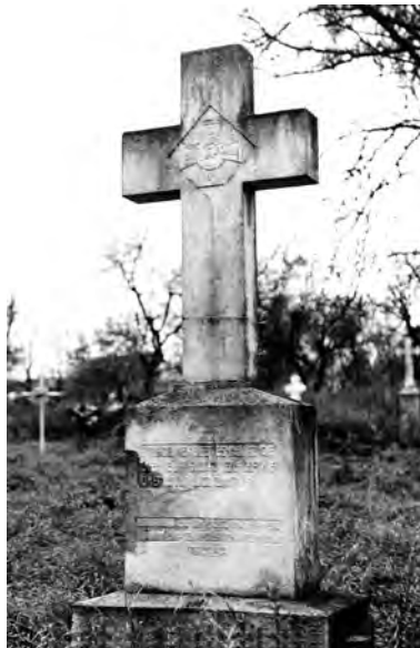
28. Rarańcza, kwatera polskiego cmentarza wojskowego, jeden z krzyży z 1934 r. na zbiorowej mogile. Fot. R. Brykowski, 1997 r.

Ośrodek wystawy. W 1996 r. została zorganizowana wystawa pt. „Kościoły diecezji łuckiej” 43 , któ-