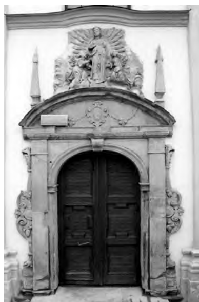
9. Grodno, kościół pobrygidkowski, obecnie ss. nazaretanek, portal główny, 1634–1642, po pracach zabezpieczających. Fot. J. Smaza, 1996 r.