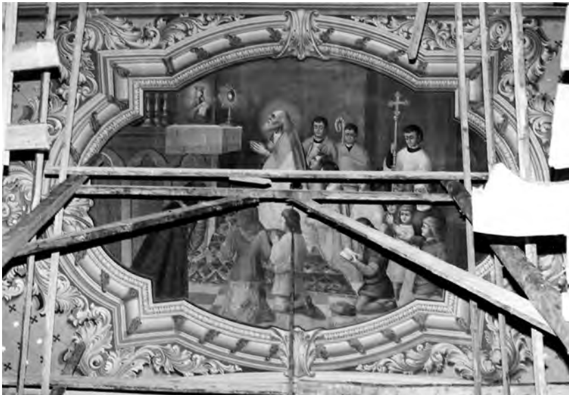
12. Kutry, kościół parafialny, malowidło ze sceną przedstawiającą bł. Jakuba Strzeмиę, stan po pracach konserwatorskich. Fot. K. Patejuk, 1998 r.

19. K. Kudelski, Protokół z dn. 14 V 1997 (dot. stanu zachowania malowideł przedstawiających błogosławionego Jakuba Strzeмиę w kościele parafialnym w Kutach na Pokuciu) , Warszawa, rkps; K. Patejuk, Dokumentacja konserwatorska. Kościół parafialny p.w. Serca Pana Jezusa w Kutach (dot. polichromii) , Warszawa 1997, mpis.