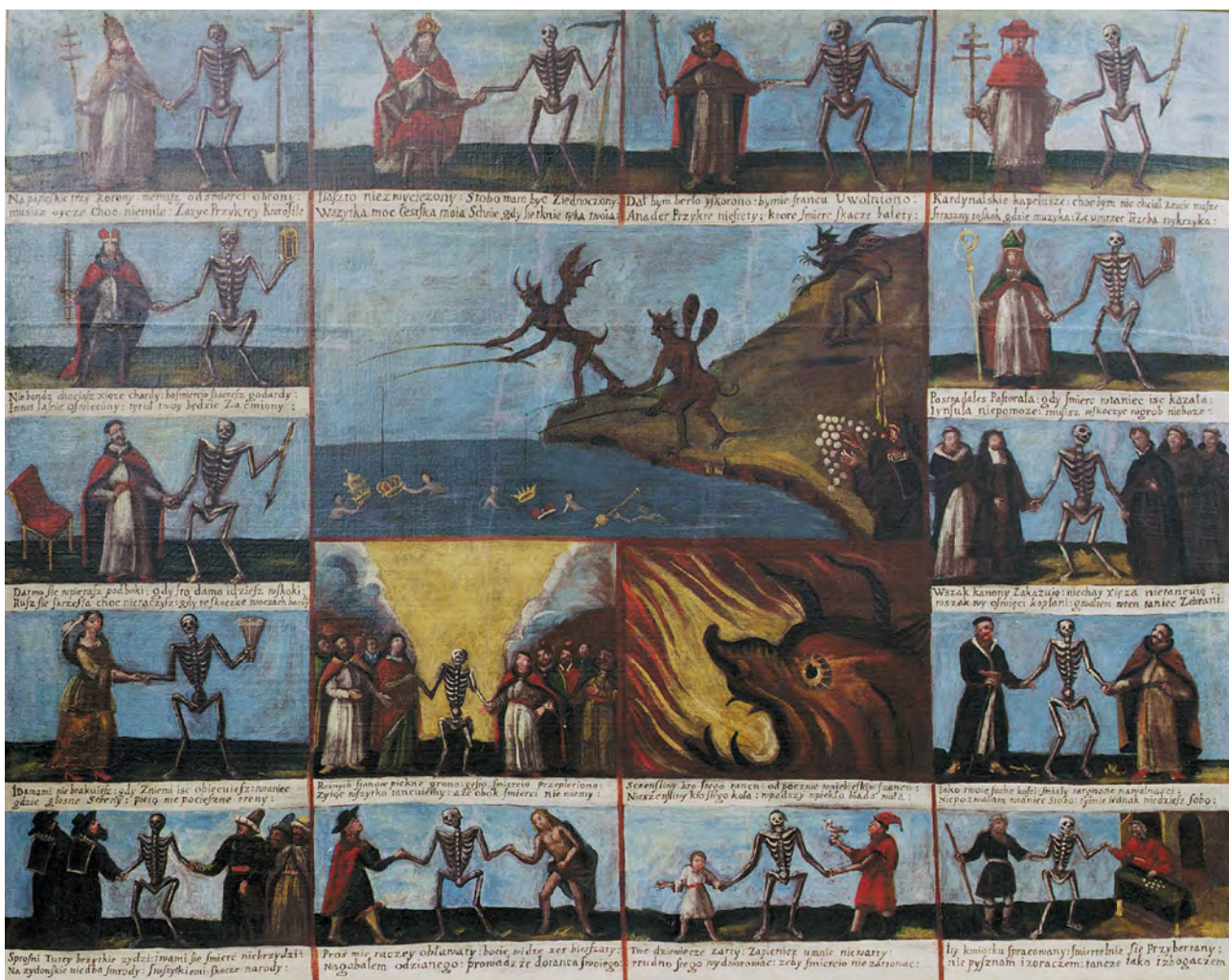
2. Grodno, kościół pobrygidkowski, obecnie ss. nazaretanek. Obraz „Taniec śmierci”, XVIII w., po pracach konserwatorskich. Fot. A. Stasiak, 1996 r.

zeum klasztorne. Prace konserwatorskie wykonała Pracownia Konserwacji Malarstwa Państwowego Przedsiębiorstwa Pracownie Konserwacji Zabytków w Warszawie kierowana przez mgr kons. Izabelę Malczewską 3 . Po zakończeniu prac konserwatorskich została zorganizowana w Muzeum Archidiecezjalnym w Warszawie