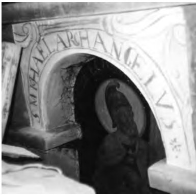
13. Dobromil, kościół parafialny, odkryty fragment dekoracji oraz napis: „S. MICHAEL ARCHANGELUS” nad wnęką arkadową od południa przy chórze muzycznym (we wnęce postać bł. Władysława z Gielniowa, 1935 r., malowana zapewne na postaci św. Michała Archanioła), po pracach konserwatorskich. 1996 r.