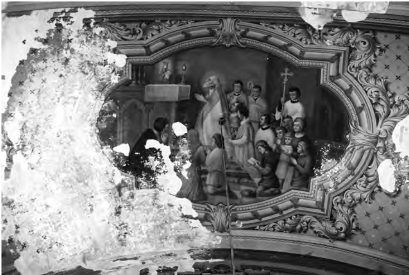
11. Kutry, kościół parafialny, 1898 r., malowidło na sklepieniu zachodniego przęsła nawy ze sceną przedstawiającą bł. Jakuba Strzeмиę, arcybiskupa-wyznawcę, 1909 r., mal. Wacław Jakub Jeziorko, stan przed pracami konserwatorskimi. Fot. K. Patejuk, 1997 r.