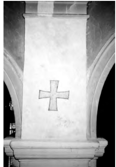
15. Dobromil, kościół parafialny, zacheuszek odkryty na północnym pilistrze pomiędzy arkadami chóru muzycznego, 1753 r., po pracach konserwatorskich.