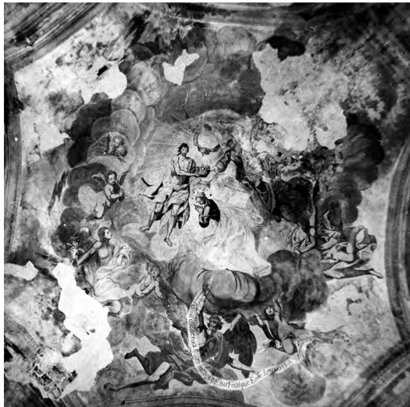
26. Holoby, kościół parafialny, kopuła kaplicy z malowaną sceną koronacji NMP, ok. poł. XVIII w., może malował pijar Łukasz Hünel. Fot. R. Brykowski, 1993 r.

W 1996 i 1997 r. kontynuowano wspólnie z Zarządem Głównym Towarzystwa Opieki nad Zabytkami organizację Kursów Miłośników Zabytków Ojczystych i Pamiątek Historycznych 41 . Kursy odbyły się w Domu Pracy Twórczej Ministerstwa Kultury i Sztuki w Radziejowicach; wzięło w nich udział 54 naszych Rodaków z Białorusi, Litwy, Ło-