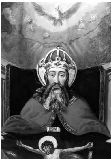
5. Ten sam fragment obrazu po pierwszym etapie prac konserwatorskich.