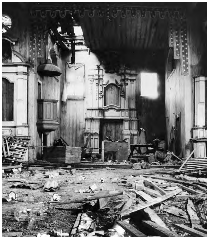
16. Wiszenki, kościół parafialny, 1771 r., wewnątrz przed przeniesieniem do Kowla, w głębi ołtarz główny, po 1771 r. Fot. G. Ruszczyk, 1993 r.