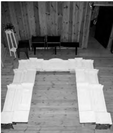
17. Kowel, kościół parafialny (przeniesiony z miejscowości Wiszenki), prace konserwatorskie i składanie ołtarza głównego. Fot. o. Z. Majcher, 1997 r.

W następnych latach przewiduje się malowanie ołtarzy i wykonanie do nich kopii obrazów z kościołów w kraju. Kierownictwo Ośrodka próbowało spełniać rolę doradczą w odniesieniu do spraw konserwatorskich i urządzenia wnętrza kościoła górnego, tzn. kościoła przeniesionego z Wiszenek 27 . Niestety, trudno było znaleźć w wielu sprawach wspólne stanowisko z kierownictwem parafii i wiele prac wykonanych zostało niezgodnie z zaleceniami i ustaleniami konserwatorskimi. Kwestia ta poruszona została w przykrości, ale wymaga tego zaistniała sytuacja, aby niewłaściwe rozwiązania nie zostały przypisane akceptacji ze strony Ośrodka 28 . Oczywiście w ramach dobrej woli część tych niewłaściwych rozwiązań można by niewielkim kosztem usunąć.