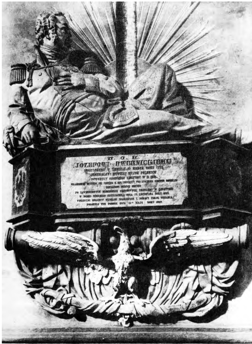
18. Lwów, dawny kościół oo. karmelitów, obecnie cerkiew, Nagrobek gen. Józefa Dwernickiego, 1864 r., rzeźbiarz Parys Filippi. przed 1939 r.

został w 1991 r. w sposób barba-ryński usunięty z kościoła, w wyniku czego poszczególne jego elementy zostały zniszczone od 50 do 80% 29 . Po interwencjach Kon-