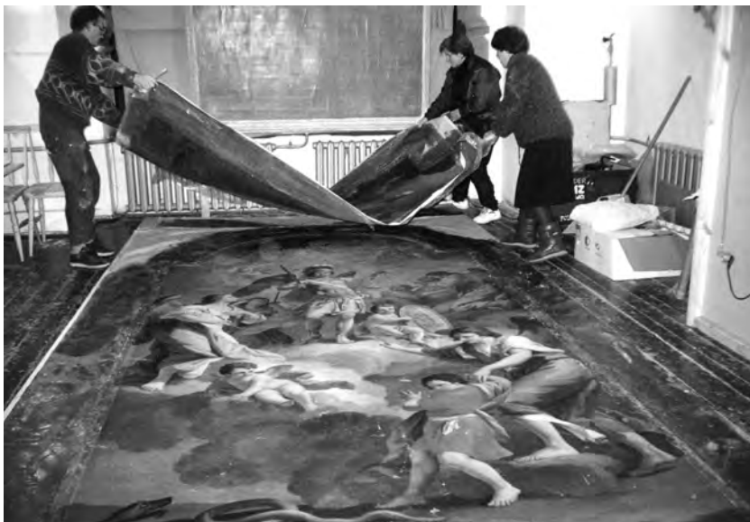
6. Łuck, katedra. Obraz „Św. Michał Archanioł”, syg. przez mal. Tadeusza Kuntze (Tadeusz Kuniec, 1732–1792), po zdjęciu z walka, przed pracami konserwatorskimi. Fot. I. Malczewska, 1997 r.

W ramach prac własnych Ośrodka przeprowadzono prace zabezpieczające przy dwóch siedemnastowiecznych portalach z kościo-