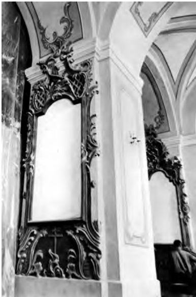
27. Nowogródek, kościół poddominikański, ołtarze boczne przy międzynawowych filarach, 2 poł. XVIII w., w trakcie prac konserwatorsko-rekonstrukcyjnych. Fot. R. Brykowski, 1995 r.

Ośrodek wystawy. W 1996 r. została zorganizowana wystawa pt. „Kościoły diecezji łuckiej” 43 , któ-