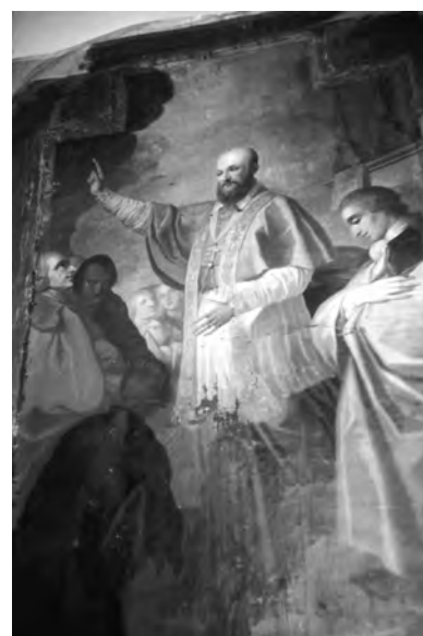
8. Łuck, katedra. Obraz „Kazanie św. Franciszka Salezego”, XVIII w., stan przed pracami konserwatorskimi. Fot. I. Malczewska, 1997 r.