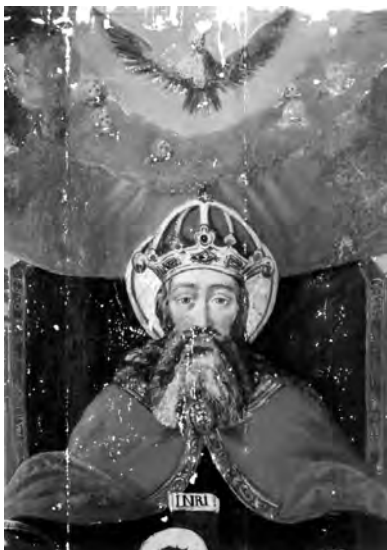
4. Fragment obrazu „Trójca Święta”, stan w czasie konserwacji. Fot. Archiwum Pracowni Konserwatorskiej Stanisława Stanionisa w Wilnie, 1997 r.