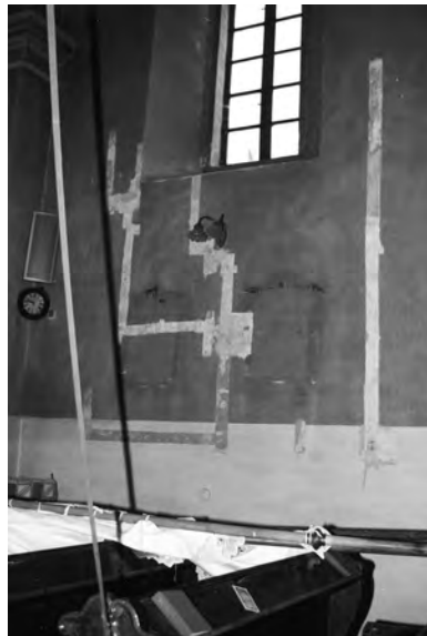
14. Dobromil, kościół parafialny, 2 poł. XVI w., ściana południowa nawy, odkrywane pasowe w poszukiwaniu dawnych malowideł. Fot. K. Kudelski, 1996 r.