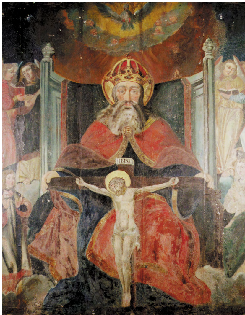
3. Szylany, kościół filialny. Obraz „Trójca Święta” — typ ikonograficzny Tron Łaski, prawdopodobnie 1520–1540 z krakowskiej szkoły malarstwa późnogotyckiego i XVII w., stan po konserwacji.

Częściowe odsłonięcie przemalówek z Tronu Łaski oraz tła obrazu potwierdziło datowanie obrazu i jego powiązanie z krakowską szkołą malarstwa późnogotyckie-