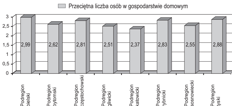
WYKRES 1: Przeciętna liczba osób w gospodarstwie domowym z podziałem na podregiony w skali kraju ze szczególnym uwzględnieniem województwa śląskiego w 2011 roku