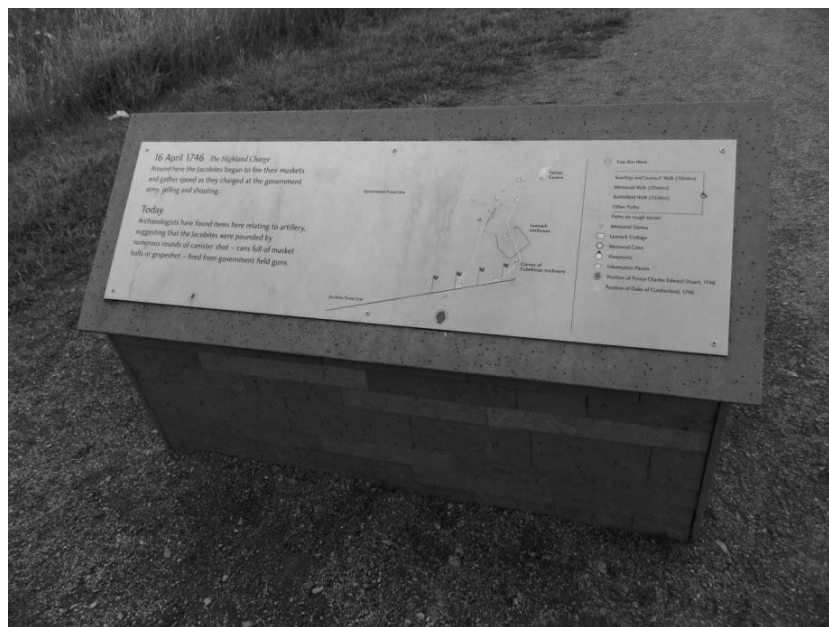
Rycina. 3. Pulpit informacyjny pomagający turystom „odczytywanie” historycznego krajobrazu pobojuwiska

infrastruktury telekomunikacyjnej pod ziemią, usunięto zalesienia z czasów późniejszych niż bitwa, przekierowano drogę prowadzącą do cmentarza klanów czy odtworzono częściowo ogrodzenia Culwhinac i Leanach.