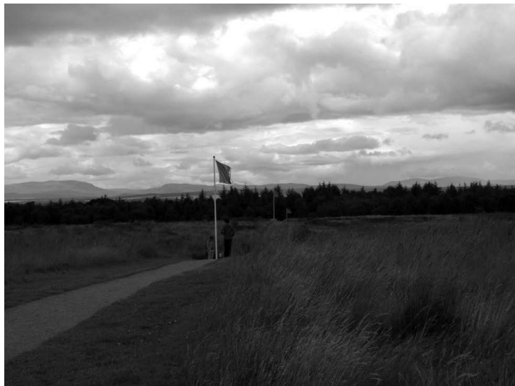
Rycina. 2. Maszty flagowe unaoczniające rozmieszczenie wojsk na pobojuwisku Culloden Źródło: fot. D. Chylińska (2013 r.).

Współcześnie interpretacji wydarzenia i pielęgnowaniu pamięci o nim służy centrum muzealne z nowoczesną, multimedialną ekspozycją 24 , natomiast doświadczanie historycznej przestrzeni/krajobrazu ułatwiają umieszczone na pobojuwisku maszty flagowe (ryc. 2), których różnokolorowe flagi ukazują rozmieszczenie opozycyjnych sił w początkowej fazie bitwy. Zastosowanie tego rodzaju rozwiązania jest możliwe i skuteczne dla wizualizacji sytuacji militarnej na polu bitwy przede wszystkim wtedy, gdy możliwe jest utrzymanie na pobojuwisku kontaktu wzrokowego między miejscami rozłożenia wojsk uczestniczących w starciu.