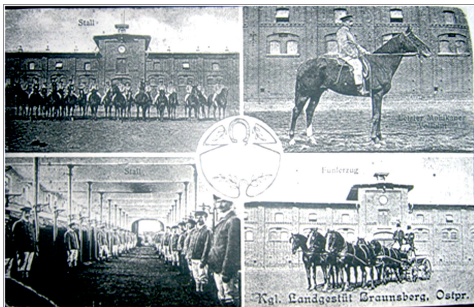
Fot. 1. Widok ogólny ośrodka hodowlano-jeździeckiego w Braniewie, okres dwudziestolecia międzywojennego.

że rozwijającej się coraz bardziej hipicznej rywalizacji. Z jeździectwem łączyło się tradycyjnie myślistwo. Szczególnie dobre warunki dla potrzeb myślistwa znajdowały się w należącym do stadniny folwarku Kalpakin. W samych Trakenach trzymano zaś liczną sforę psów myśliwskich, dla których zbudowano specjalnie okazałe pomieszczenia 2 . Rumaki pod wierzch, po uprzedniej selekcji, trzymane były w tzw. stajni jeździeckiej. Tam oswajano je z siodłem, szkolono w biegach myśliwskich i w celach towarzysko-sportowego współzawodnictwa. Tego typu sporty uprawiano początkowo na wytyczonym do tego celu i specjalnie przygotowanym terenie, na którym znajdowało się 350 różnych naturalnych przeszkód. W latach późniejszych wzniesiono przy stadninie dużą krytą ujeżdżalnię, tor wyścigowy oraz szkołę dżokejów 3 . Ujeżdżalnie, a także place maneżowe znajdowały się również w zakładach hodowli koni w Kętrzynie i Braniewie.