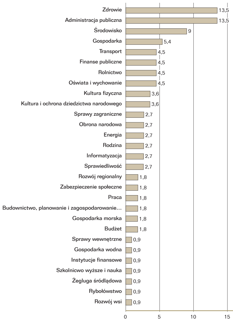
Rysunek 1. Udział poszczególnych kontroli według działów administracji rządowej (w %)