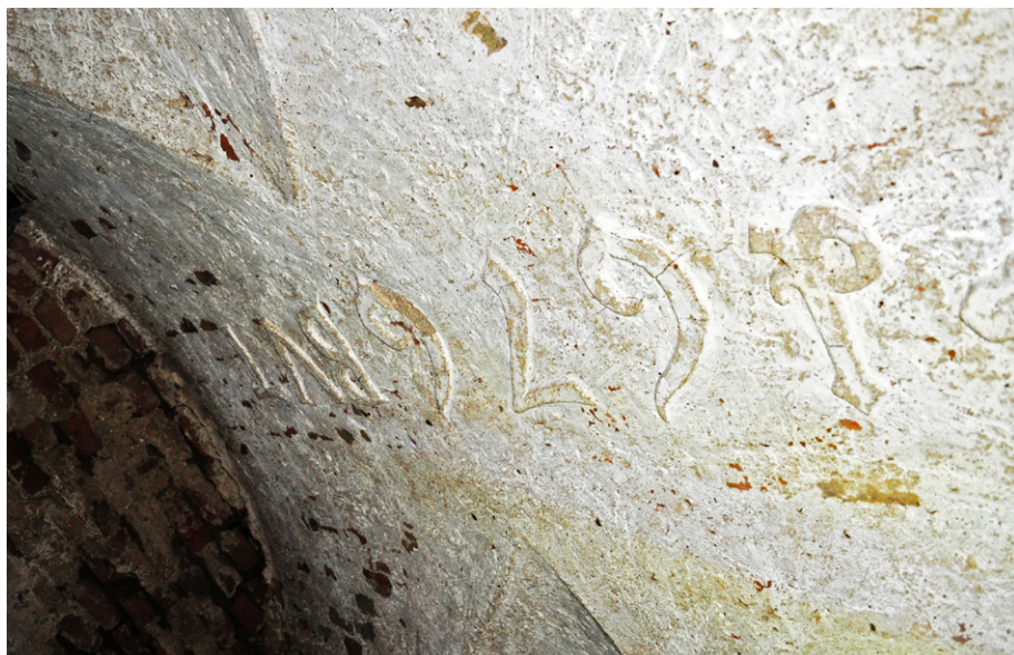
Ryc. 2. Piaseczno, gm. Gniezno, woj. pomorskie. Sklepienie krypty z datą fundacji 1676