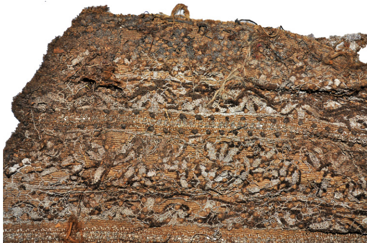
Fig. 11. Piaseczno, Gniew commune, pomorskie voivodeship. Silk fabric with a composition of bobbin lace and embroidery