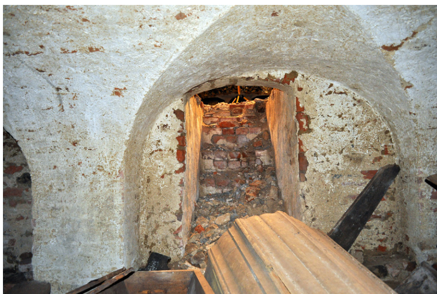
Ryc. 5. Piaseczno, gm. Gniew, woj. pomorskie. Szyja krypty pod prezbiterium od środka

Na wprost wejścia stało bardzo duże wieko trumny pomalowane na żółty kolor (Ryc. 5), z nabitą datą 1808 i inicjałami X D A. Po prawej stronie znajdowała się skrzynia z dużą ilością wymieszanych tkanin i szczątków kostnych (Ryc. 6). Żeby mieć możliwość oceny sytuacji w krypcie, wyniesiono skrzynię na zewnątrz. Dopiero wtedy można było zobaczyć porozbijane fragmenty trumien (część z nich złożono w stosach pod ścianą północną), a szczątki wraz z wyposażeniem były wdeptane w klepisko (Ryc. 7, 8). Klepisko ze szczątkami tworzyło ossuarium, podobne do ossuarium w pobliskim kościele św. Mikołaja w Gniewie (Grupa et al. 2015a, 13–17, 149–158; Kozłowski, Grupa 2019, 35–43). Różnica jednak była istotna, w Gniewie ossuarium w krypcie południowej utworzono ze szczątków pochodzących z czyszczenia grobów pod posadzką kościoła.