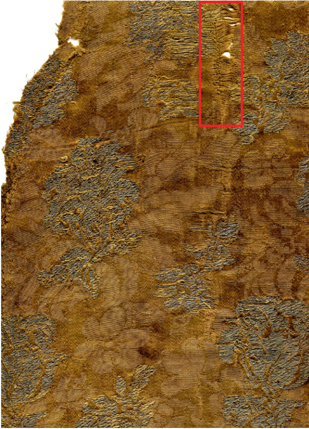
Ryc. 16. Piaseczno, gm. Gniew, woj. pomorskie. Kolumna boczna ornatu z wzorem kwiatowym podkreślonym metalową nicią. W czerwonej obwódce fragment cerowania