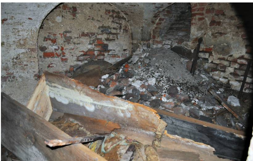
Ryc. 13. Piaseczno, gm. Gniew, woj. pomorskie. Ściana południowa ze stertą zsypanych z zewnątrz śmieci pod otworem wentylacyjnym

Tylko w czterech przypadkach można powiedzieć o komplecie szat liturgicznych (ornat, manipularz, stuła) i to niepełnym, ponieważ dopasowano cztery stuły do bocznych kolumn ornatów wykonanych z tych samych tkanin. Pozostałe tkaniny zdecydowanie różniły