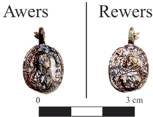
Ryc. 12. Piaseczno, gm. Gniew, woj. pomorskie. Awers i rewers medalika z wizerunkiem Matki Boskiej Szkaplerznej i św. Onufrego po konserwacji