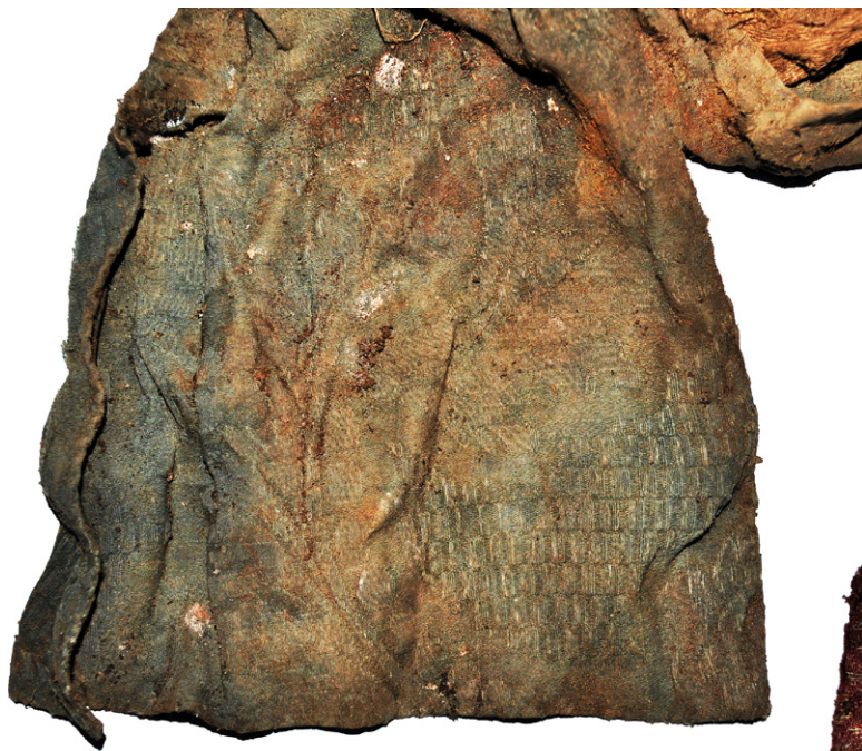
Ryc. 14. Piaseczno, gm. Gniew, woj. pomorskie. Fragment paletki z jedwabnego adamaszku przed konserwacją

Fig. 14. Piaseczno, Gniew commune, pomorskie voivodeship. Fragment of a silk damask palette before conservation