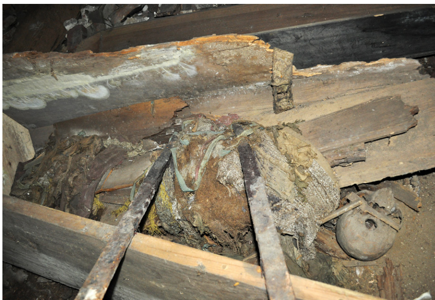
Fig. 6. Piaseczno, Gniew commune, pomorskie voivodeship. Mixed fabrics and bone remains inside the coffin

Ryc. 7. Piaseczno, gm. Gniew, woj. pomorskie. Fragmenty trumien, tkaniny i szczątki ludzkie na klepisku krypty