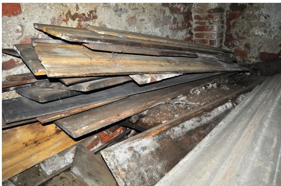
Fig. 8. Piaseczno, Gniew commune, pomorskie voivodeship. Coffins boards piled under the northern wall of the crypt

Ryc. 8. Piaseczno, gm. Gniew, woj. pomorskie. Deski z trumien ułożone pod ścianą północną krypty