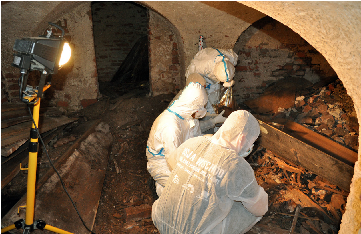
Ryc. 9. Piaseczno, gm. Gniew, woj. pomorskie. Ekipa badawcza w czasie prac w krypcie (fot. D. Grupa)