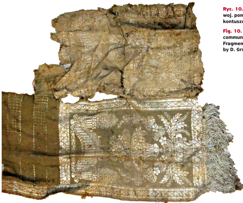
Ryc. 10. Piaseczno, gm. Gniew, woj. pomorskie. Fragment pasa kontuszowego