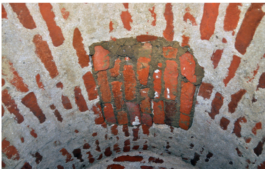
Fig. 4. Piaseczno, Gniew commune, pomorskie voivodeship. The vault in the “treasury” with a bricked-up opening

budowy użyto różnych cegieł bardzo niedbale połączonych. Ściana południowa jest odcinkiem S muru obwodowego prezbiterium z otworem wentylacyjnym (Ryc. 3). Łukowo kształtowane zwieńczenie otworu od strony wewnętrznej niemal w całości zakrywa nadbudowane sklepienie. Wnętrze wyłożone jest cegłami w układzie wozówkowym (dwie na każdy poziom), ułożonym pod kątem, tak by tworzyły równą powierzchnię o kącie nachylenia ok. 45°. W przeciwnym krańcu pochylnia przechodzi w pionową ścianę, powodując przewężenie światła kanału, przez co w ścianie zewnętrznej muru obwodowego czytelny jest jedynie niewielki prostokątny otwór. Drugie z pomieszczeń określane jest jako „skarbiec”. Pomieszczenie przesklepiono kolebką. Cegły ścian (wskazują na stosowanie układu wendyjskiego i/lub wozówkowego). Sklepienia oklejone są znaczną ilością zaprawy murarskiej. W środkowo-wschodniej części sklepienia znajdował się otwór wtórnie wybity, zamurowany cegłami datowanymi na różne okresy (najprawdopodobniej to cegły z odzysku), połączonymi zaprawą cementową (Ryc. 4). Ów otwór znajduje się w okolicy obecnie