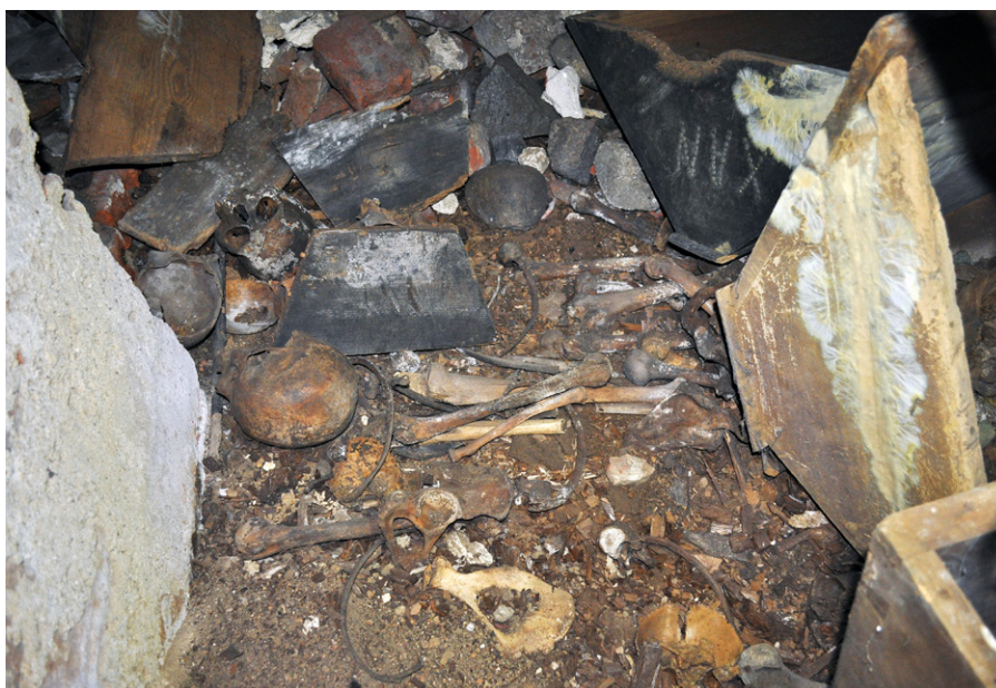
Fig. 7. Piaseczno, Gniew commune, pomorskie voivodeship. Coffin fragments, textiles and human remains on the crypt's earthen floor

Ryc. 8. Piaseczno, gm. Gniew, woj. pomorskie. Deski z trumien ułożone pod ścianą północną krypty