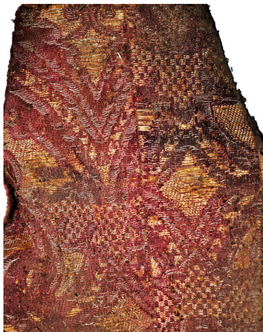
Fig. 15. Piaseczno, Gniew commune, pomorskie voivodeship. Fragment of a manipule sewn from pieces of thick fabric with a geometric and plant ornament

się od siebie i nie udało się utworzyć z nich kompletów szat, co oczywiście miało miejsce w przeszłości, tylko trudno to było teraz ustalić. Zasada była dość prosta: księży chowano w starych szatach liturgicznych wyłączonych już z posługi w czasie Mszy Świętej. Zresztą było to zgodne z zaleceniami soborów regulujących przepisy związane z paramentyką kościelną. Szaty grobowe mogły być kompletowane z różnych zestawów, co potwierdzają pochówki księży pijarów z krypty pod prezbiterium w kościele pw. Imienia Najświętszej Marii Panny w Szczuczynie (Dudziński et al. 2017, 125, 128–130, 132–134, 138, 142–144, 146; Grupa 2019, 177, 178) oraz pochówek bp. Józefa Tadeusza Kierskiego z krypty biskupów przemyskich w kościele katedralnym pw. św. Jana Chrzyciela i Wniebowzięcia Najświętszej Maryi Panny (Drażkowska 2014, 108, 438).