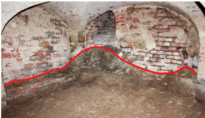
Fig. 3. Piaseczno, Gniew commune, pomorskie voivodeship. The cleaned crypt with the border line of the raised earthen floor visible on the walls. The level is marked with a red line

Ryc. 4. Piaseczno, gm. Gniew, woj. pomorskie. Sklepienie w „skarbcu” z zamurowanym otworem