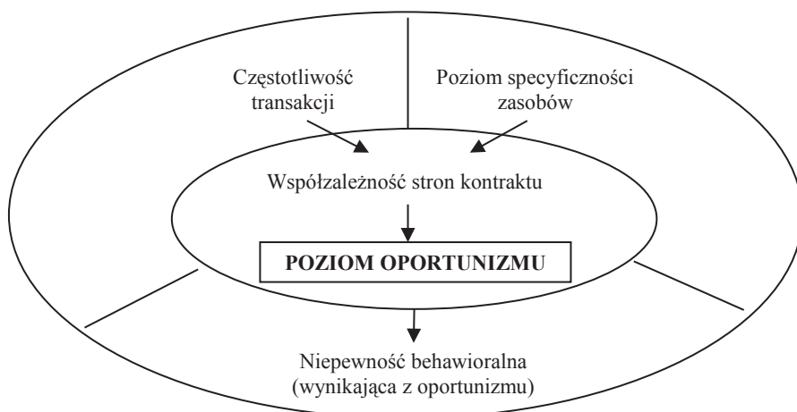
Rys. 1. Rodzaj transakcji a poziom oportunizmu (w świetle koncepcji O.E. Williamsona)

Poziom oportunizmu zależy od rodzaju transakcji, który z kolei jest zdeterminowany m.in. przez częstotliwość zawierania transakcji oraz poziom specyficzności