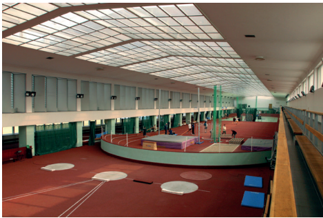
Ryc. 12. Hala gier (wnętrze), AWF Warszawa proj. W. Zabłocki

wklęsłej siatki cylindrycznej, spoczywającej na stalowych słupach na obwodzie. Autor tak opisuje koncepcję projektu: „Powyżej 2.70 m sale treningowe są ze wszystkich stron przeszklone, co daje iluzję zawieszenia lekkich wklęsłych dachów między drzewami i stwarza atrakcyjny klimat wnętrza” [Zabłocki 2007, s. 23-27]. Sala gier (do rozgrywek koszykówki i piłki ręcznej) w Akademii Wychowania Fizycznego w Warszawie została zaprojektowana przez Wojciecha Zabłockiego przy współpracy ze Stanisławem Kusiem i Romanem Wilczyńskim (projekt 1970, realizacja 1974). Sala została dobudowana do istniejącej hali lekkoatletycznej projektu Edgara Norwertha. Konstrukcja przykrycia areny sportowej o wymiarach 32,5 m x 45 m jest rozwiązana jako wisząca na linach, liny co 2,5 m zakotwione są w żelbetowych belkach, dwa charakterystyczne pochyłe słupy – zastrzały w kształcie litery „V” mają zadanie stabilizacji konstrukcji i stanowią interesujący rzeźbiarski wyróżnik dla bryły. Arena może pomieścić 800 widzów (ryc. 12, 13).