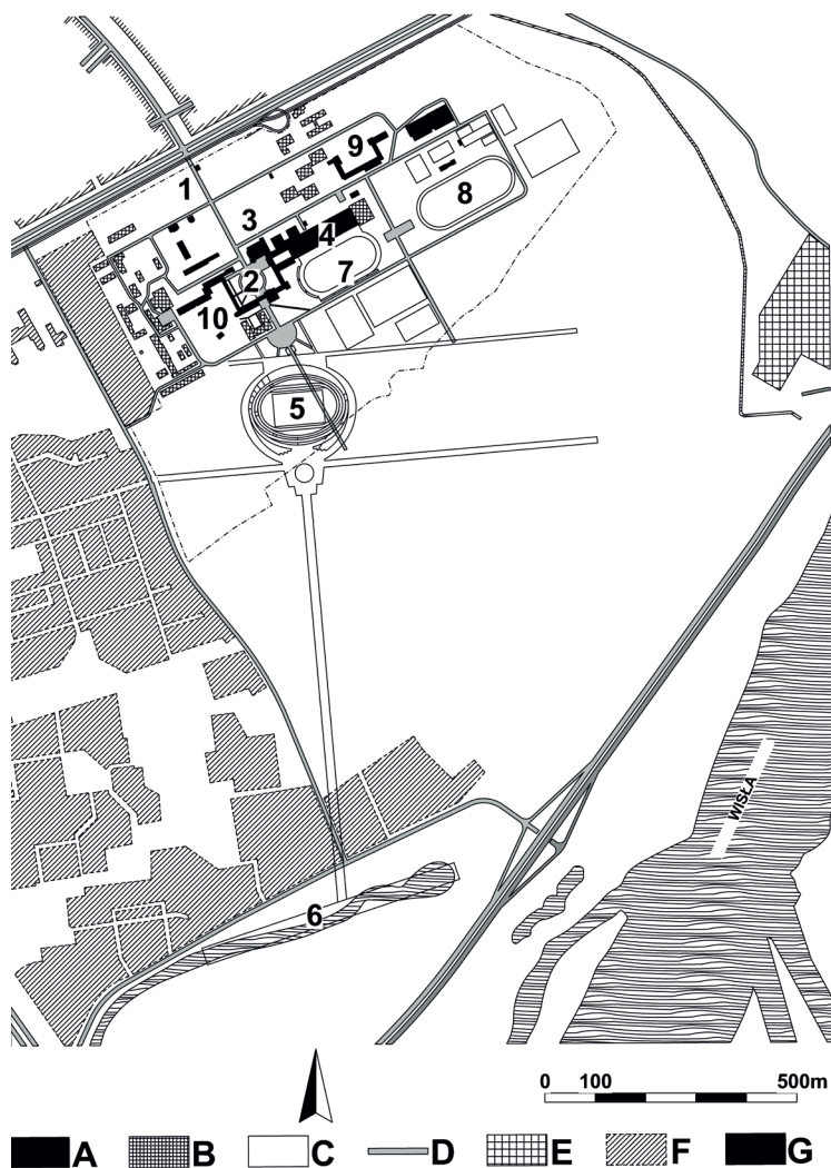
Ryc. 3. Plan zespołu CIWF (AWF) w Warszawie przy ulicy Marymonckiej 34 z naniesieniami zmianami inwestycyjnymi w latach 1928–2016

Objaśnienia: A – oryginalne realizacje wg Planów Edgara Norwertha z 1930 r., B – uzupełnienia zabudowy kampusu po 1945 r., C – niezrealizowane plany Edgara Norwertha, D – drogi, E – uzupełnienia infrastruktury sportowej po 1945 r., F – zabudowa mieszkaniowa poza granicami kampusu AWF, 1 – wejście główne, 2 – pływalnia kryta, 3 – budynki dydaktyczne i akademik żeński, 4 – domy pracowników, 5 – dziedziniec przed Gmachem Głównym, 6 – stadion lekkoatletyczny, 7 – stadion rugby, 8 – boisko, 9 – lokalizacja Stadionu Narodowego (obiekt niezrealizowany), 10 – lokalizacja toru wioślarskiego (obiekt niezrealizowany), 11 – ulica Marymoncka, 12 – Aleja Zjednoczenia, 13 – Wisła, 14 – Kościół i klasztor oo. Kamedułów, 15 – rezerwat Las Bielański