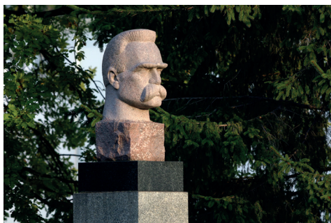
Ryc. 9. AWF w Warszawie. Pomnik Józefa Piłsudskiego, założyciela CIWF w Warszawie i obecnie patrona uczelni

W latach 60. i 70. kontynuowano modernizację i rozbudowę uczelni: wzniesiono kolejne obiekty dydaktyczne i sportowe, domy studenckie, cztery pawilony do treningów (boks, judo i zapasy, podnoszenie ciężarów i szermierka), halę lekkoatletyczną, halę gier, Centrum Medycyny Sportowej (ryc. 9, 10, 11).