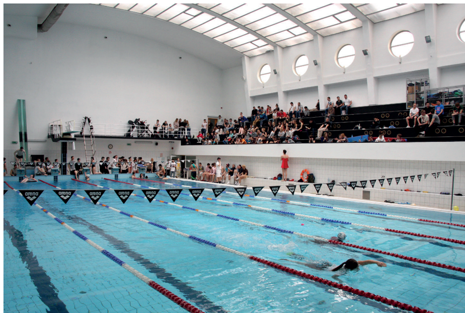
Ryc. 5. Pływalnia kryta AWF Warszawa, proj. E. Norwerth, 1928, stan obecny (wnętrze w czasie zawodów)