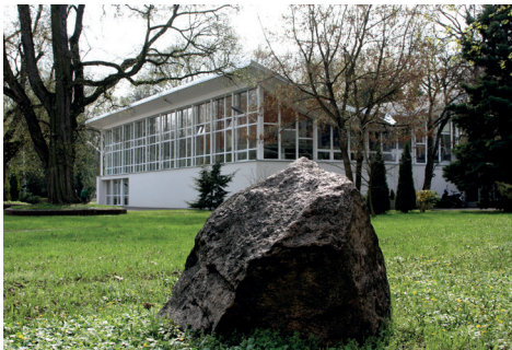
Ryc. 10. Pawilon walk (widok elewacji od strony północno-wschodniej), AWF Warszawa, proj. W. Zabłocki

Fot. M. Godlewska, 2008, archiwum AWF Warszawa