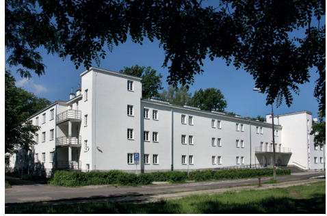
Ryc. 7. Widok budynku dydaktycznego AWF Warszawa, stan obecny

Fot. M. Godlewska, 2004, archiwum AWF Warszawa