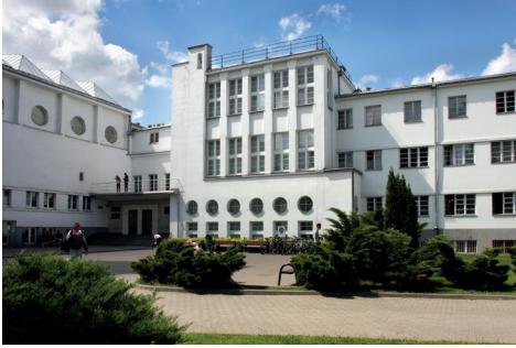
Ryc. 6. Widok Gmachu Głównego AWF Warszawa, stan obecny

Fot. M. Godlewska, 2004, archiwum AWF Warszawa