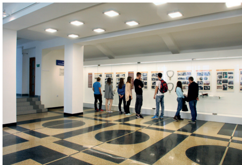
Ryc. 8. Pływalnia kryta AWF Warszawa, proj. E. Norwerth, 1928, stan obecny (wnętrze w czasie zawodów)

W połowie lat 50. wprowadzono jednolite, 4-letnie studia magisterskie, uruchomiono w ramach wydziału specjalizacje trenerskie oraz rehabilitacji ruchowej. Od 1959 r. AWF Warszawa otrzymała jako pierwsza w kraju prawo nadawania stopnia doktora w zakresie nauk o kulturze fizycznej, a od 1966 r. – uprawnienia do przeprowadzania przewodów habilitacyjnych w tej samej dziedzinie. Od 1970 r. istnieje filia uczelni w Białej Podlaskiej. W 1984 r. powołano w ramach uczelni Wydział Rehabilitacji (ryc. 6, 7, 8).