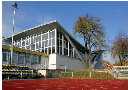
Ryc. 13. Hala gier (widok elewacji od strony wschodniej), AWF Warszawa proj. W. Zabłocki

Fot. M. Godlewska, 2014, archiwum AWF Warszawa