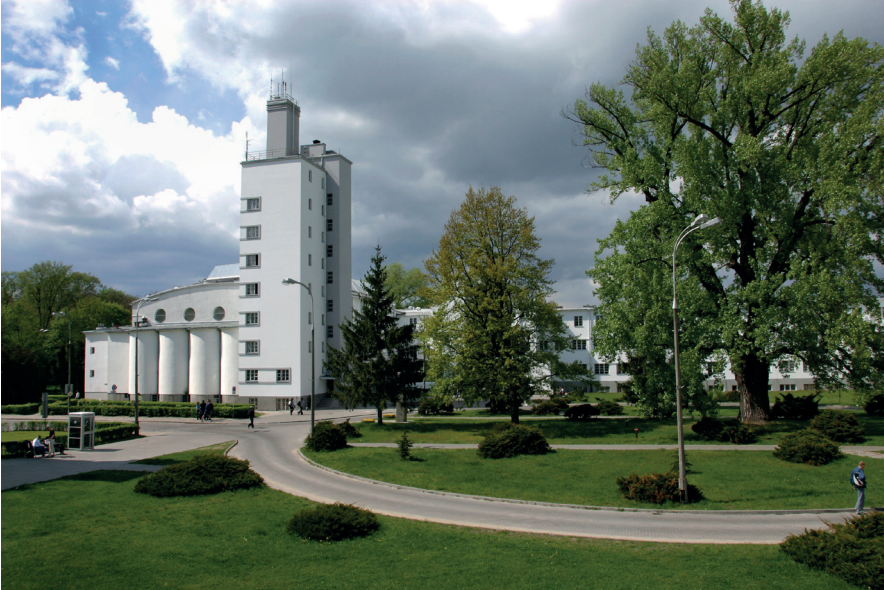
Ryc. 4. Widok krytej pływalni AWF Warszawa, proj. E. Norwerth 1928 r., stan obecny

Uroczysta inauguracja pierwszego roku akademickiego 1929/1930 miała miejsce w dniu 29 listopada 1929 r., chociaż już trzy tygodnie wcześniej rozpoczęto zajęcia ze studentami. Dla upamiętnienia tego niezwykle doniosłego wydarzenia, w tym dniu corocznie obchodzone jest „Święto Uczelni”.