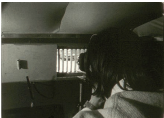
Tajne filmowanie z tzw. ruchomego punktu zakrytego, czyli specjalnie przygotowanego samochodu. Kadry z filmu „Operacyjny film dokumentalny w Ministerstwie Spraw Wewnętrznych”