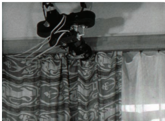
Aparat Pentacon Super przystosowany do seryjnego fotografowania z punktu zakrytego. Kadry z filmu instruktażowego „Pentacon Super”