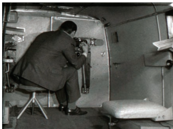
Wywiadowca fotografujący z ruchomego punktu zakrytego. Kadry z filmu instruktażowego „Pentacon Super”