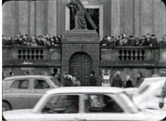
Demonstracje w marcu 1968 r. w Warszawie. Kadry z filmu „Operacyjny film dokumentalny w Ministerstwie Spraw Wewnętrznych”, epizod „Wypadki marcowe”