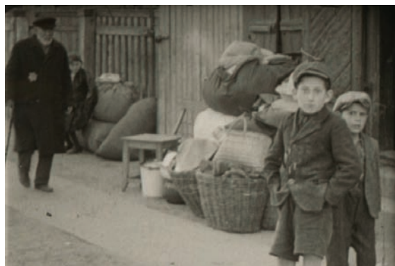
Kadry z niemieckiego filmu amatorskiego dokumentującego przesiedlenie kutnowskich Żydów do getta 16 VI 1940 r.