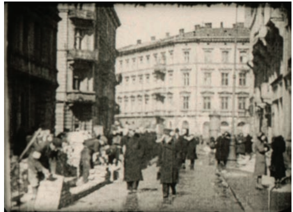
Sceny z warszawskiego getta z niemieckich filmów z okresu okupacji