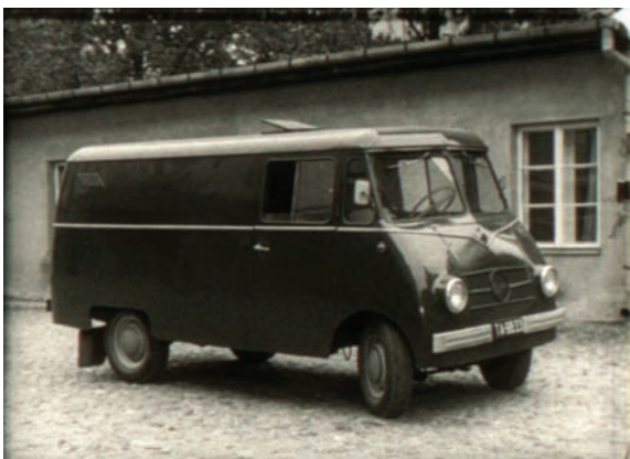
Ruchomy punkt zakryty, czyli samochód przystosowany do tajnego fotografowania. Kadry z filmu instruktażowego „Pentacon Super”