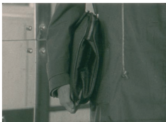
Tajne filmowanie przy pomocy tzw. modelu fotograficznego, czyli kamery ukrytej w teczce. Kadry z filmu „Operacyjny film dokumentalny w Ministerstwie Spraw Wewnętrznych”