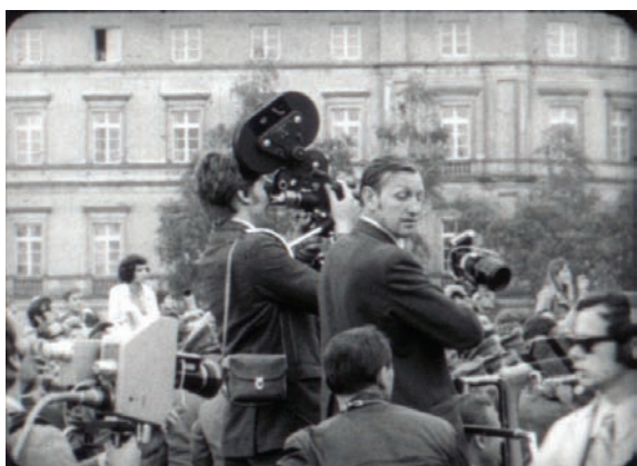
Filmowanie przejazdu prezydenta Nixona pod tzw. legendą, czyli jawnie, podając się za ekipę telewizji. Kadry z filmu „Operacyjny film dokumentalny w Ministerstwie Spraw Wewnętrznych”, epizod „Wizyta prezydenta Nixona w Polsce”