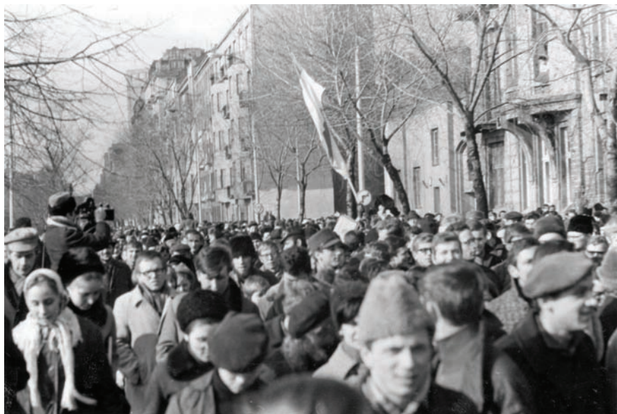
Operator SB filmujący demonstrantów w czasie wydarzeń marcowych w Warszawie.