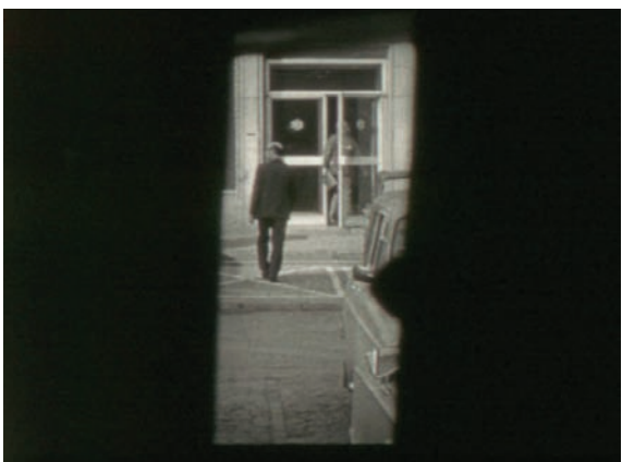
Zdjęcie wykonane z ruchomego punktu zakrytego. Kadry z filmu instruktażowego „Pentacon Super”