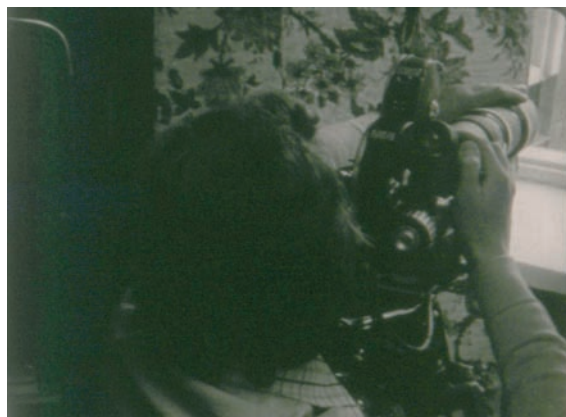
Tajne filmowanie z tzw. punktu zakrytego, czyli zakonspirowanego lokalu. Kadry z filmu „Operacyjny film dokumentalny w Ministerstwie Spraw Wewnętrznych”