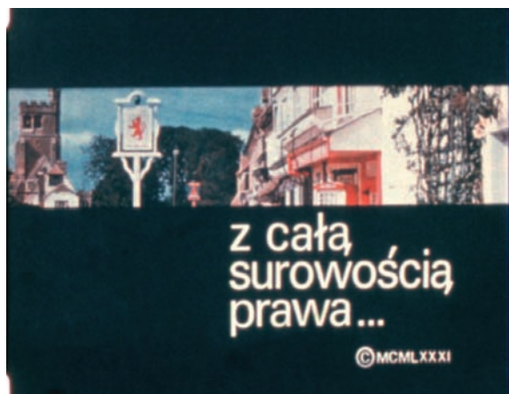
Plansze tytułowe filmu „Z całą surowością prawa” na temat sprawy operacyjnej kryptonim „Tramp” dotyczącej działalności szpiegowskiej Leszka Chrósta