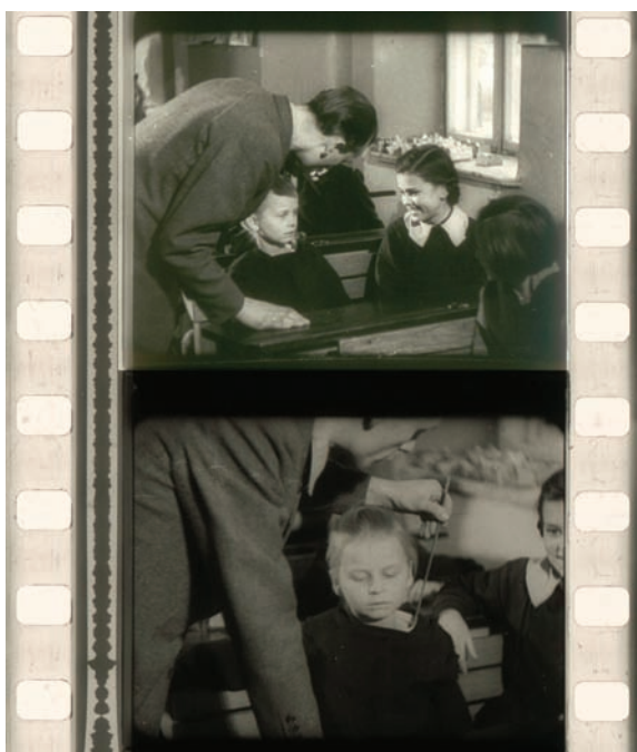
Kadry z antysemitckiego filmu propagandowego „Życie ludzkie w niebezpieczeństwie” zrealizowanego w 1941 r., przeznaczonego do rozpowszechniania na terenie Generalnego Gubernatorstwa