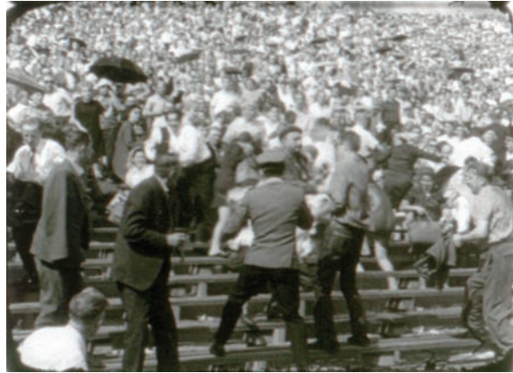
Samospalenie Ryszarda Siwca na Stadionie Dziesięciolecia w Warszawie w czasie dożynek w 1968 r. Kadry z filmu „Operacyjny film dokumentalny w Ministerstwie Spraw Wewnętrznych”, epizod „Sprawa kryptonim «Wawel»”